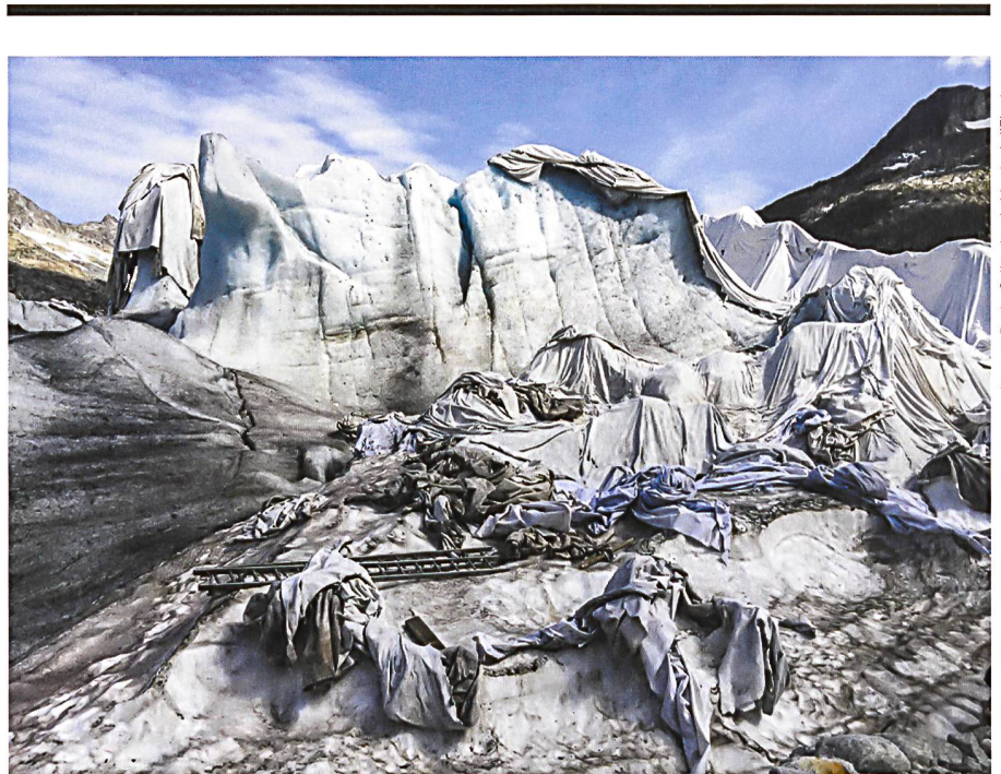
Jacques Pugrin, Collection du Musée de l'Elysée