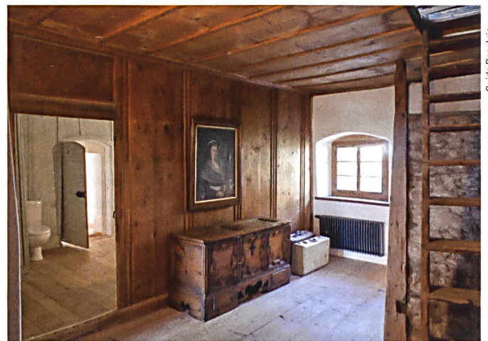
Seitenkorridor im 1. Obergeschoss mit Blick in eines der Badezimmer. Die Mauern gehören teilweise zum Ursprungsbau aus dem Spätmittelalter. Die Wand- und Deckentäfer wurden um 1720 eingebracht, die Holzböden 1902.

L'aile gauche de la maison, avec le pressoir, remonte à 1720 environ. Dans l'aile droite, en arrière de l'arcade ajoutée vers 1780 et des étages, sommeillent les fondations d'origine datant de la fin du Moyen Âge.