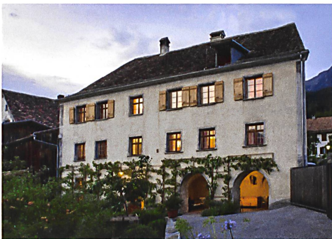
Der linke Hausteil mit Torkel stammt aus den Jahren um 1720. Im rechten Hausteil hinter der um 1780 errichteten Arkade mit aufgehenden Geschossen schlummert der spätmittelalterliche Ursprungsbau.

Als früherer Hausbesitzer wird Pfarrer Christian von Moos (1715–1782) genannt. Durch Erbschaft gelangte das Haus