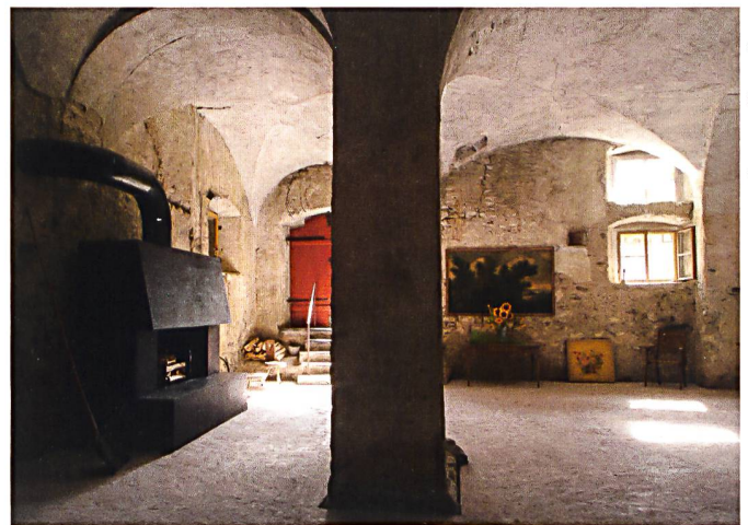
Der Torkel im Gartengeschoss. Der hohe, gewölbte Raum von 1720 wird durch den Kamin aus Stahl von 2007/08 schlicht und modern akzentuiert. Ehemals Ort der Weinherstellung wird der Raum heute für Veranstaltungen genutzt.

La salle de bains du premier étage: la cabine de douche et le lavabo, très contemporains, contrastent de manière raffinée avec le bâtiment historique rénové. Les boiseries datent de 1720 environ.