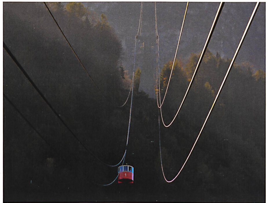
Bayerisches Landesamt für Denkmalpflege, Michael Forstner