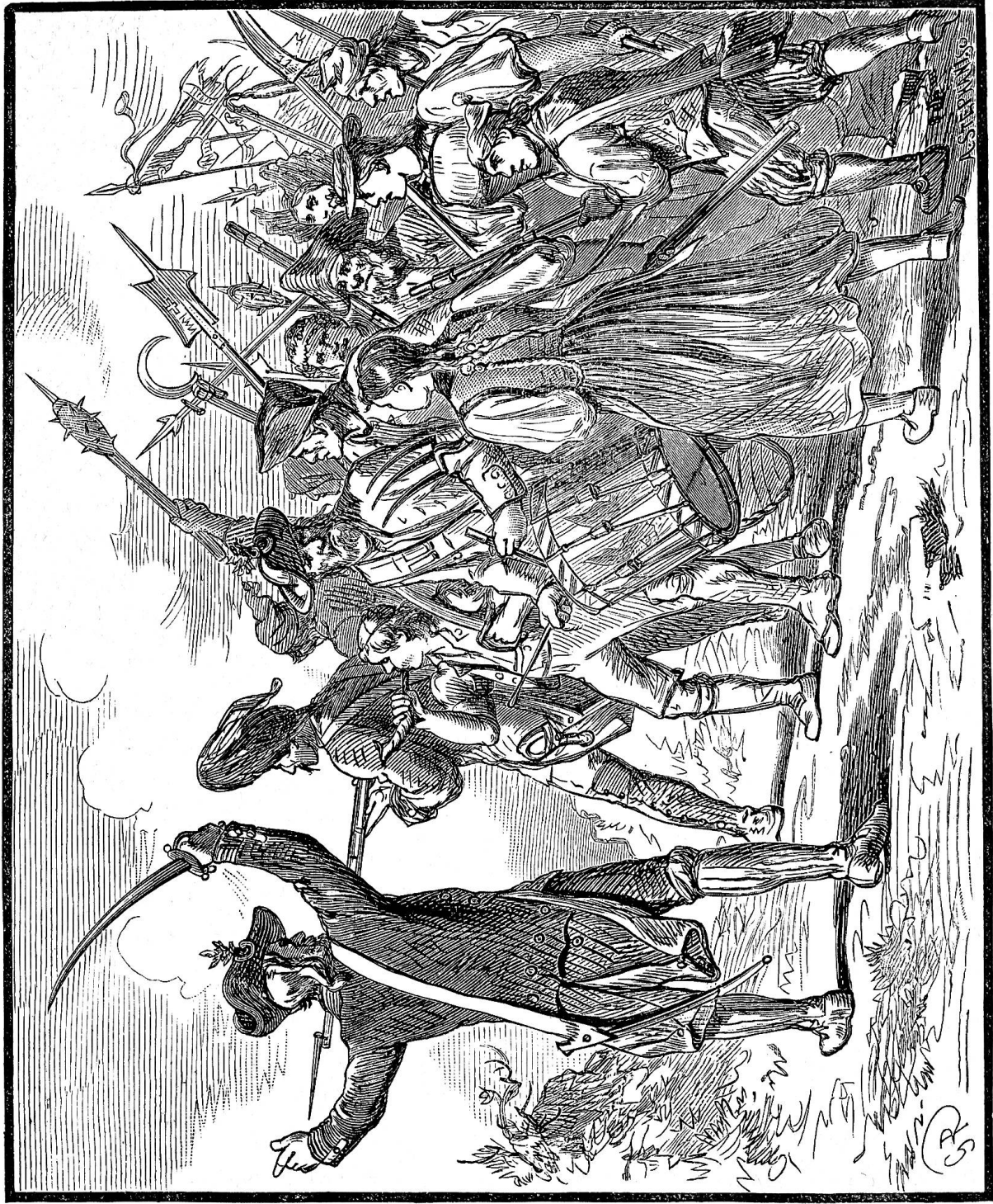
Der Bandsturm von 1798.