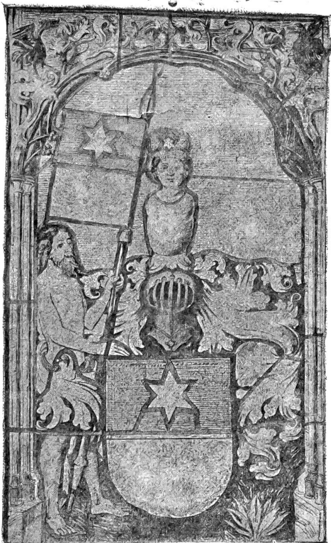
Wappen der Bubenberch.

Auch das Aussehen der Stadt kann man sich im 13. Jahrhundert kaum bescheiden genug denken. Wenn einer jener ersten „Bürger“ heute wiederkäme und unsere mächtigen Sandsteinbauten erblickte, er würde seine Wohnstätte nicht wiedererkennen. Dorfartig, durch Gärten, Scheuern, Stallungen unterbrochen, waren die hölzernen Häuser aneinander gereiht. Die Dächer zeigten zwar gewiß von Anfang an die burgundische, die Front des Hauses wagrecht abschließende Form im Unterschied von den schwäbischen Giebelhäusern, wie sie in Schaffhausen, Zürich und Zug die Regel bildeten. Auch die Lauben waren schon in den Anfängen vorhanden. Aber die Bedachung bestand nur aus Stroh oder Schindeln, letztere wohl auch noch mit sogenannten „zentrigen Dachnägeln“, d. h. Steinen, beschwert, wie