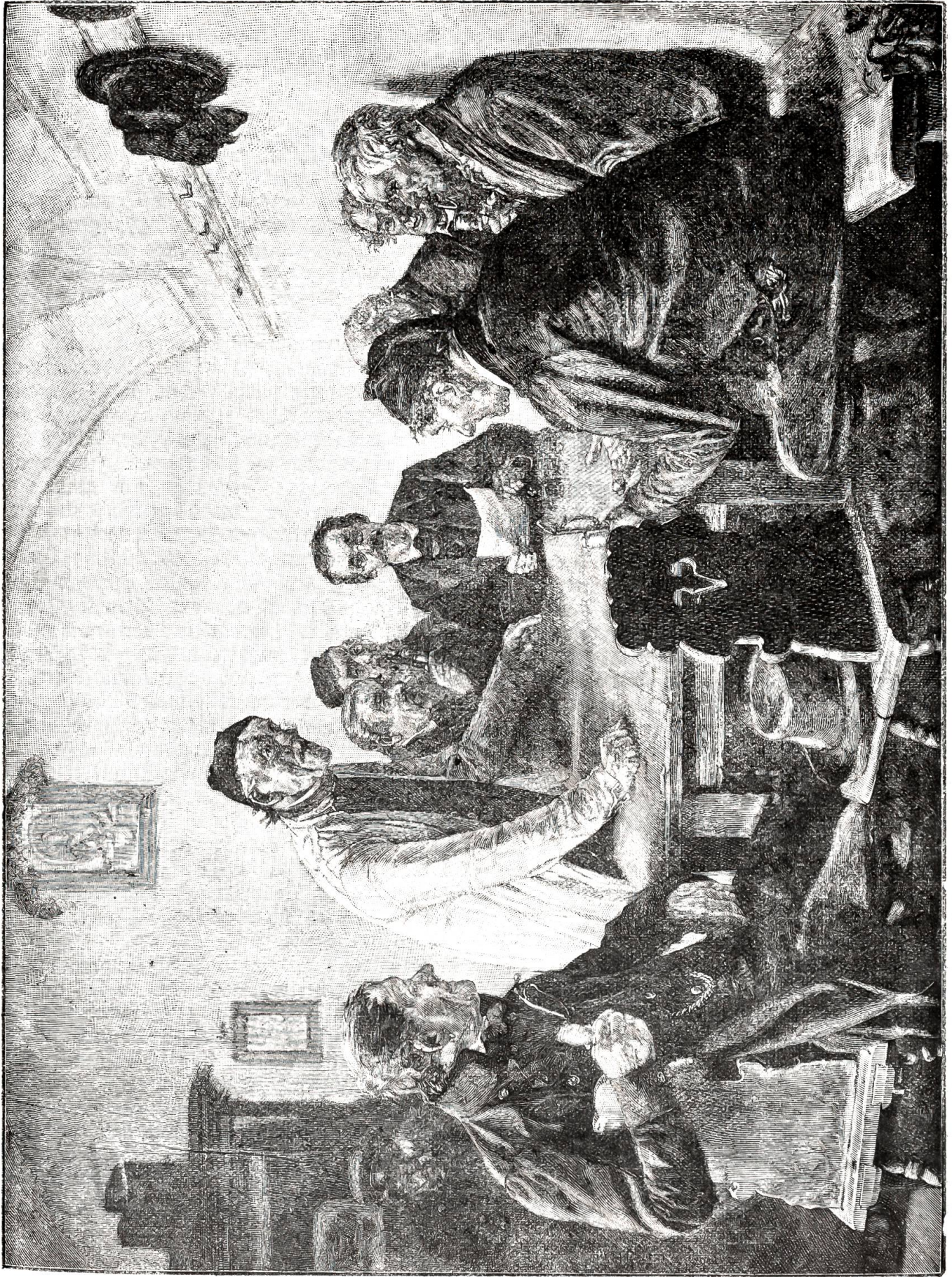
..Mit kritischer Ausdruck seines intelligenten Gesichtes hatte er...