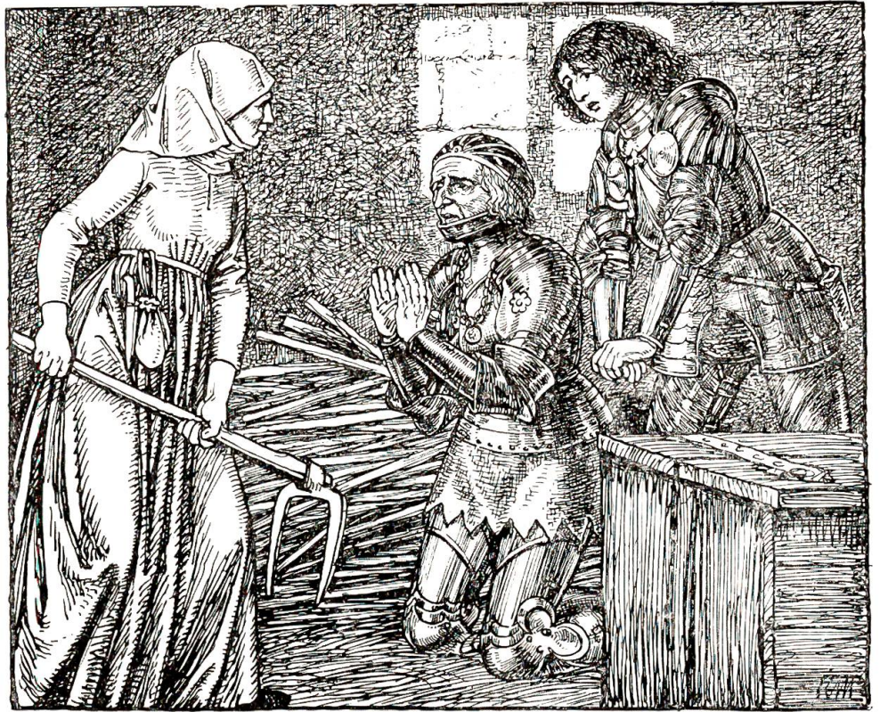
Da haben die Herren sie um Christi Leiden und martervollen Todes willen gebeten sie sollt sie nit verrathen.

Harnisch nit verkauft, denn sie dieselben lösen und mehr dafür geben wollten als kein anderer gab. Und da es dunkel und man die Thor schloß führt ich sie fort, und waren gar in großer Angst als sie am Bruderholz die Feur der Schweizer sahend, die da besammelt waren und vorhatten morndes ins Suntgau zu ziehen. Aber ich bracht sie glücklich weiters und gab ihnen wohl bey 2 Meilen weit das Gleit, denn sie nie glauben wollten daß sie in Sicherheit wären; und als ich von ihnen schied dankten sie mir über die Maßen, versprachen auch daß sie mir und den Meinen den Dienst zeitlebens nit vergessen wollten, und kann ich in Wahrheit sagen, daß sie redlich Wort hieltend,