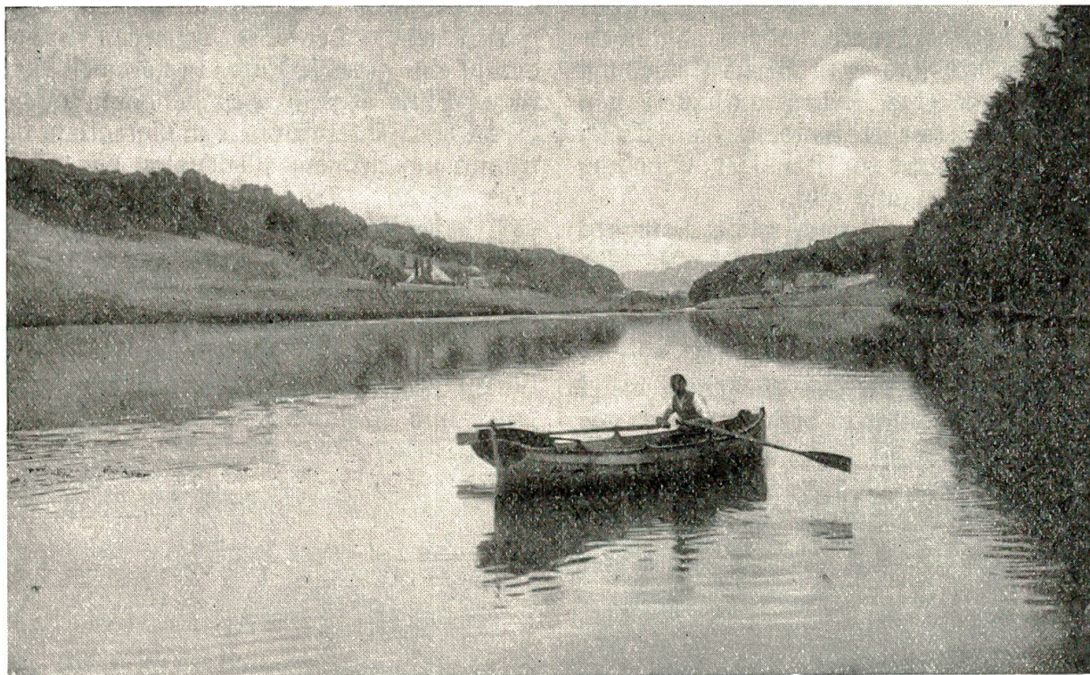
Wohlensee beim Hasli.

Dann wird es stiller und einsamer, die Behausungen und Gehöfte werden seltener. Links oben wird über einem bewaldeten Höhenzug der Kirchturm von Frauenkappelen sichtbar. Das Gelände nimmt mehr und mehr waldartigen Charakter an und beginnt wieder steiler zum See abzufallen. Wir münden allmählich in einen eigentlichen Waldsee ein, dessen Wasser bald dunkelgrün leuchten, bald von blauviolett sich abhebenden Waldesschatten gekennzeichnet sind.