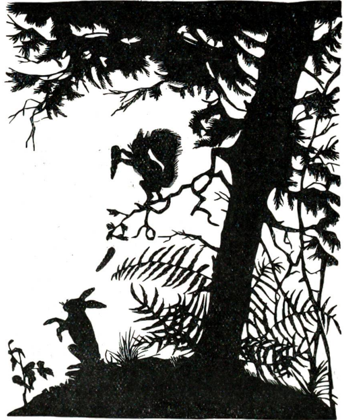
Mutter es regnet, rief ein junges Häschen, das gerade unter der Tanne saß.

Ein Rotkehlchen war neugierig herbeigeflogen. „Quivit, komm mit!“ sang es ihm zu. „Komm, tröste Dich, die Welt ist schön, beeile Dich, sie anzusehn!“ — Da hob Pinselöhrli den Kopf und trocknete die Tränen mit dem Ende seines buschigen Schwanzes; und es sah, wie