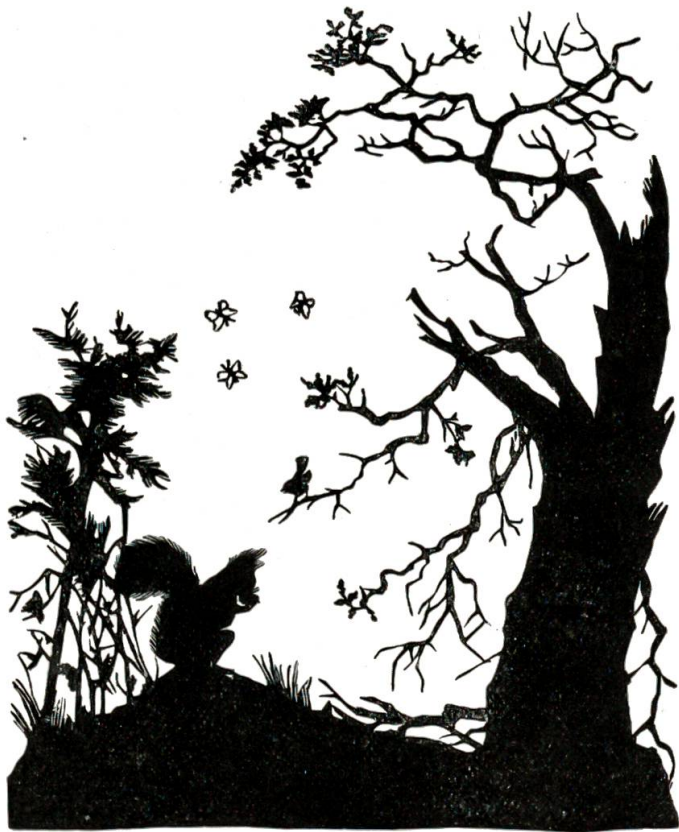
Eichhörnchen findet sein Nest und die Eiche durch den Blitz verbrannt.

„Haltet Euch gerade, streckt Euch in die Höhe, seht, so müßt Ihr's machen, daß Ihr groß und schlank werdet wie ich.“