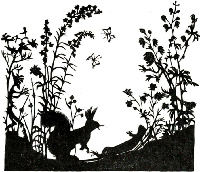
Pinseleohrli wäre beinahe über eine grüne Eidechse gestolpert, die in der Sonne lag.

dem Weidenröschen süße Augen, und der Eisenhut schaute wütend drein und drohte mit den Armen.