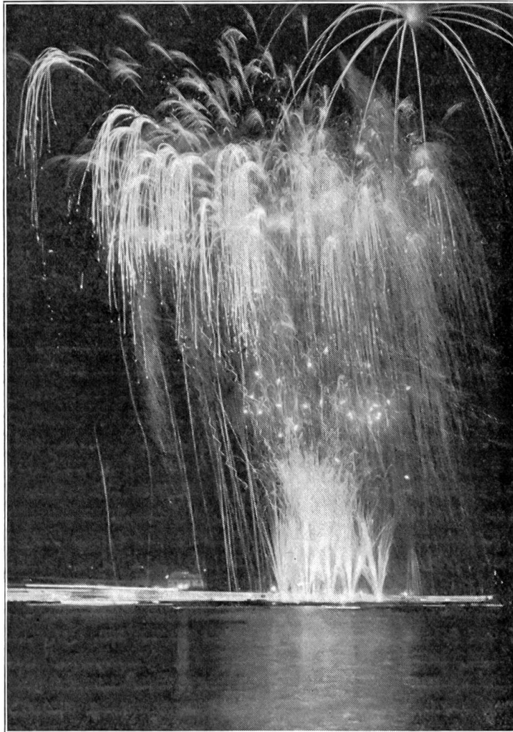
Seenachtfest Luzern.

an dessen Gestade bis in die schöne Statt la Rochelle; dorten erkannte ich an einem hellen tag von der Landspitze, des Minimes genannt, die Insel Oléron. Von Nantes hatte ich den Loirefluß beständig an meiner Rechten bis Orleans; von da ritte ich in zwey Tagreisen bis Paris, eine Strecke von 30 Stunden wegs. In dieser Capitalstatt von Europa herrschet ein solch