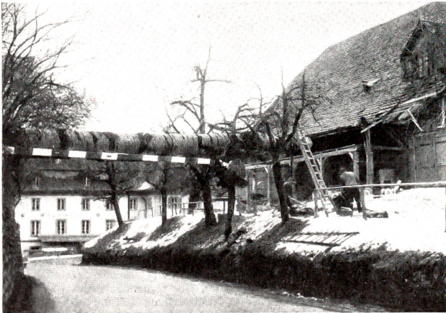
In der Wegmühle bei Bolligen fällt der Sturm einen Baum, der quer über die Straße auf das Dach eines Bauernhauses fiel.

Eine im „Kosmos, Handweiser für Naturfreunde“ im Dezember 1930 ausgelöste Rundfrage zeitigte eine Fülle von Nachrichten. Nicht immer trägt der Stollenwurm den gleichen Namen. Im Traun- und Almtal nennt ihn die Bevölkerung seines abgekipperten Schwanzes wegen den „Stutzen“ oder „Natternstug“. Die