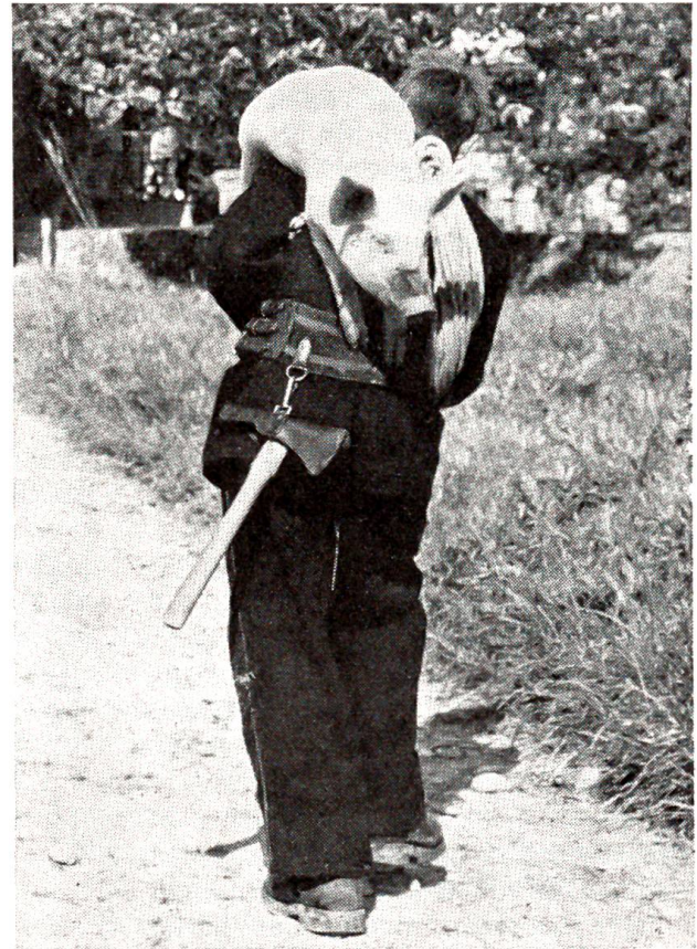
Auch den Umgang mit Tieren muß ein Feuerwehmann beherrschen

Unsere drei Hauptabschnitte „Das Bernbiet ehemals und heute“, die „Gedenktafel“ und die „Welt-