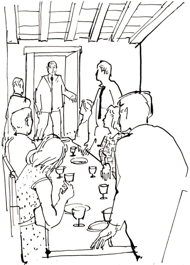
Mehr als einen, der sich vor Furcht und Schrecken gefeit glaubte, überließ die Gänsehaut

„Ach, ich habe schon so viele vergebliche Schritte unternommen. Mit meinem französischen Ausweis reiste ich bereits vor Jahren legitim in die Schweiz ein. In Noirmont und dort herum fahndete ich nach dem Mann, dem ich seinerzeit mein Fahrrad und meine Schriften verkauft habe.“