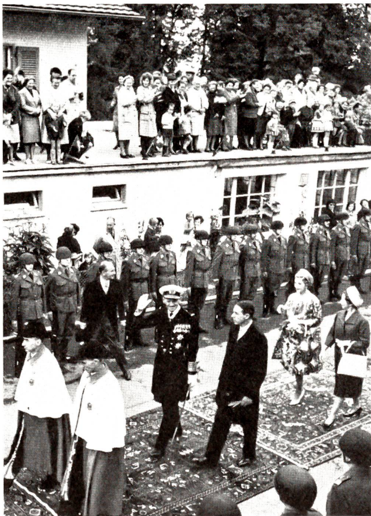
Das dänische Königspaar besuchte Mitte September 1965 die Schweiz. Hier das Herrscherpaar, begleitet von Bundespräsident Tschudi und seiner Frau, beim Empfang in Kehrsatz.