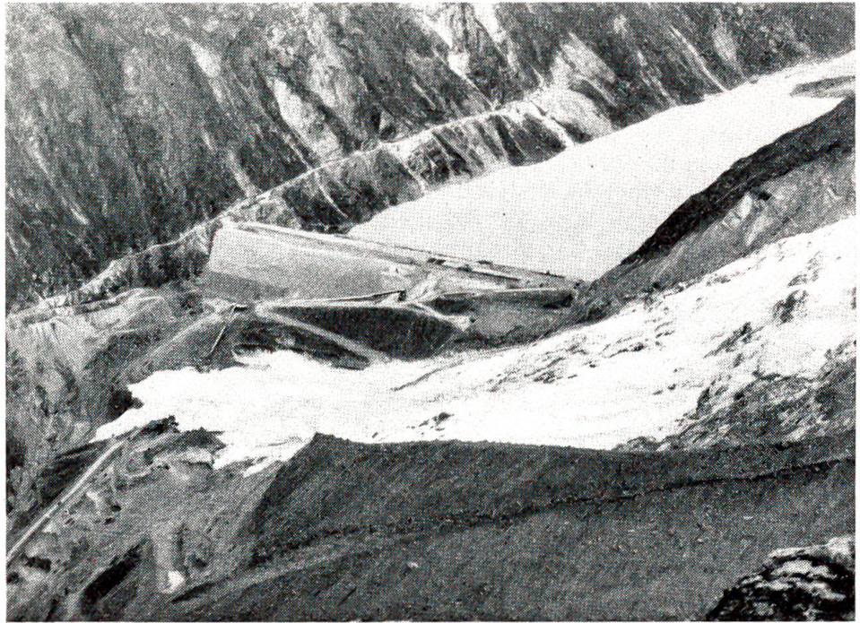
Der Gletscherabbruch bei Mattmark: Eine der schwersten Katastrophen, die in den letzten Jahren die Schweiz betroffen haben.

Seit einer Woche spielte Church abends nicht mehr mit den Kindern, er sah auch Bessie nicht mehr in die Augen, er wich ihren Blicken aus. Und lag er, halbmeterweit von Bessie getrennt, auf der Strohmatten, seine Hand dicht bei der ihren, so tastete er nicht zu Bessie hinüber, seine Hand blieb neben der ihren, ohne Frage, ohne Beteuerung, ohne Geste. Und Bessie bemerkte, wie er die Arme unter dem Nacken verschränkte, Stunde um Stunde wachlag, nach hartem Arbeitstag – und keinen Schlaf fand. Denn vor seinem inneren Auge tauchte die zierliche, kleine Reb auf, die seit einer Woche hinter dem Schalter des Materialdepots bei Williams & Williams saß. Ihre Augen trafen sich zum erstenmal, als er ein neues Waschleder holte; er sah ihre kleine, schwarze Hand und ihren festen Arm, er sah ihre Stirn und