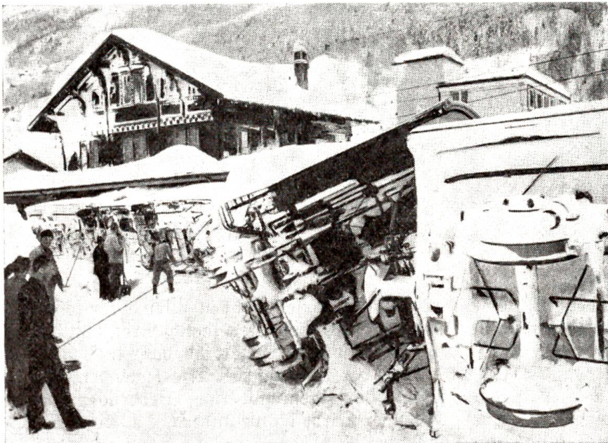
Eine riesige Lawine ging anfangs Januar in der Gegend des Bahnhofs Zermatt nieder. Sechs Eisenbahnwagen wurden vom Luftdruck aus den Schienen gehoben und umgekippt. Zum Glück gab es keine Verletzten