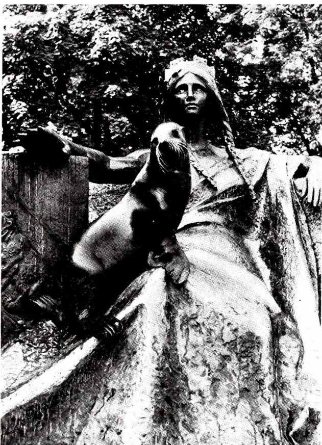
Mutter Helvetia ist nicht aus der Ruhe zu bringen. Selbst der Seelöwe des Zirkus Knie auf ihrem Schoss kann sie auf dem Weltpostdenkmal in Bern nicht erschüttern.