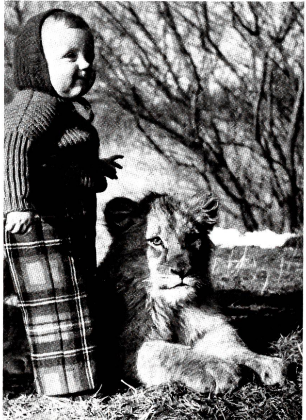
Ungewöhnliche Freundschaft

Wir sehen die Tiere im allgemeinen selten so, wie sie wirklich sind! In der Hauptsache deshalb, weil wir zu ihnen in einem freundschaftlichen Verhältnis stehen. Dies ist uns bei der höchstentwickelten Tierform, den Menschenaffen, noch am leichtesten möglich. Besonders lehrreich ist in dieser Beziehung ein Besuch des zoologischen Gartens, wo die Affen vom Publikum nur durch einen Graben oder ein Gitter getrennt sind. Das Gorillaweibchen beispielsweise versucht gar nicht, über einen vorhandenen Graben zu gelangen, da für es die einmalige Erfahrung genügt, dass die Überquerung nicht möglich ist. Der Schimpanse musste diese Erfahrung jedoch täglich immer wieder von neuem machen, trotzdem er immer wieder Beulen von misslungenen Sprüngen davontrug! Der Orang-Utan hingegen vergnügt sich stunden-