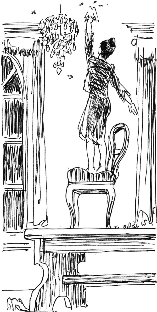
Das Persönchen auf dem Stuhl reckte sich erneut, schon fiel die zweite Hornissenleiche, die dritte, die vierte herunter.

sten, wenigstens jene, die noch nicht geflüchtet waren, drückten sich in einem grossen Kreis den Wänden entlang. Auf einmal war es mucksmäuschenstill. Alle schauten fasziniert zu, was nun wohl geschehen würde.