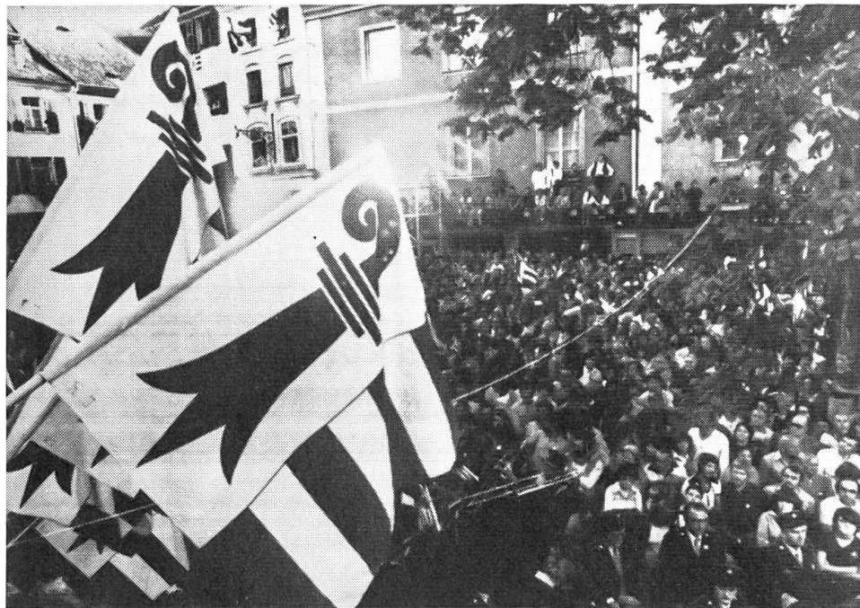
Am 24. September 1978 stimmte das Schweizervolk mit überwältigendem Mehr der Gründung des Kantons Jura zu.

Auf dem Gebiet der Aussenpolitik hat Carter den Zusammenhalt der USA mit den Verbündeten über den Atlantik hinweg durch persönliche Kontakte und ein Gipfeltreffen in der Karibik gestärkt. Die Nato, nachdem sie nun 30 Jahre alt geworden ist, soll konsolidiert und militärisch schlagkräftiger gemacht werden. Der Oberkommandierende der Nato, der amerikanische General Haig, hat demissioniert und wird durch einen Nicht-Amerikaner ersetzt. Die Beziehungen zu Japan haben im vergangenen Jahr, vor allem wegen handelspolitischer Meinungsverschiedenheiten, eine Krise durchgemacht. Hingegen verbesserten sich die Beziehungen zu China laufend. Vor Weihnachten sind überraschend die diplomatischen Beziehungen mit Peking wieder aufgenommen worden, wobei allerdings die USA de jure von Taiwan abrücken mussten. Teng Hsiao-ping hat die USA besucht. Die USA liessen sich aber von dessen Polemik gegen die UdSSR nicht beirren und hielten die Kontakte zu Moskau aufrecht. Obschon diese merklich kühler geworden sind, befehligen sich beide Supermächte fortwährend eines bemerkenswerten internationalen «Krisenmanagements» in gegenseitiger Abstimmung. Die Einigung über eine Beschränkung strategischer Waffen (SALT II) ist nun wider Erwarten zustande gekommen. Am Ende der Berichtsperiode steht man vor der Möglichkeit eines Zusammentreffens zwischen