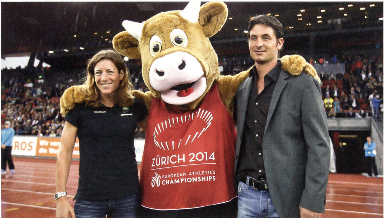
Gold an den XXX. Olympischen Spielen in London für Nicola Spirig (Triathlon) und Steve Guerdat (Springreiten)

korea verfügt über eine der grössten Militärmaschinerien, aber die wirkliche Kampfkraft ist unbekannt. Südkorea muss jedoch ständig mit dieser Bedrohung leben.