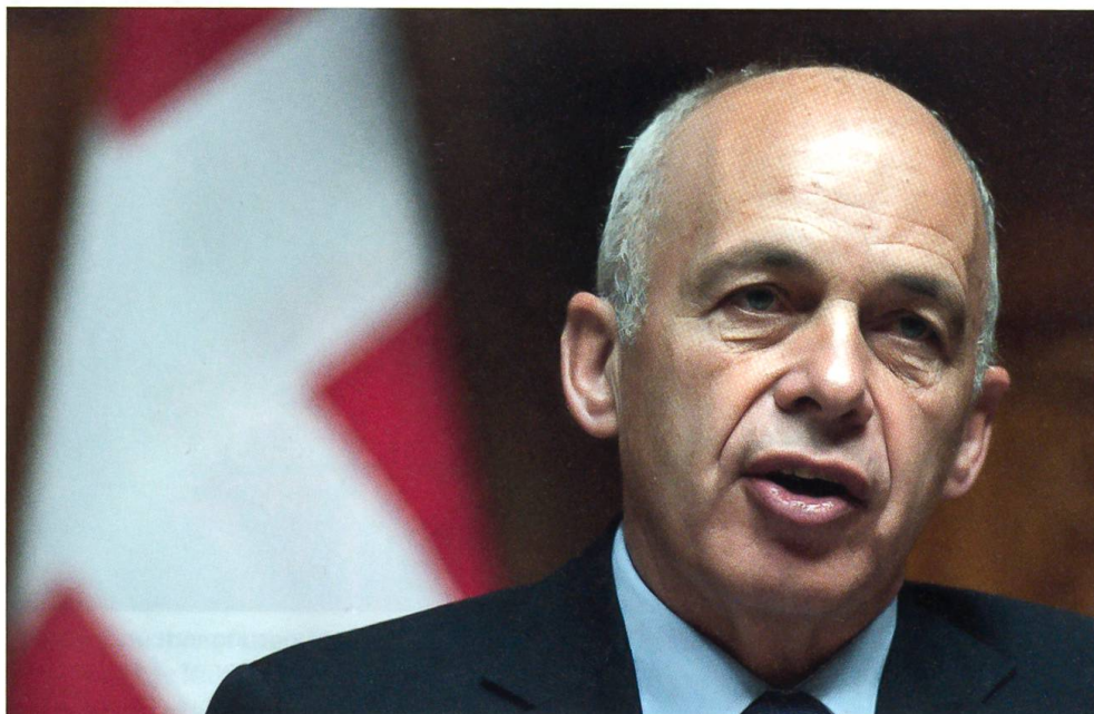
Ueli Maurer, Bundespräsident für das Jahr 2013

neuen Postgesetzgebung. Sie verläuft identisch zur Umwandlung von Swisscom, Skyguide, SBB und Ruag. Der Bund bleibt im Besitz sämtlicher Aktien.