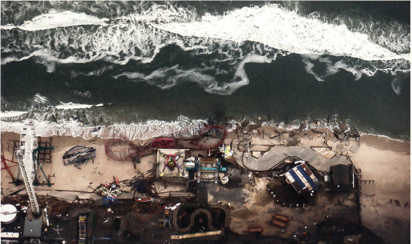
Der Hurrikan «Sandy» bringt Tod und Verwüstung auf dem amerikanischen Kontinent.

hingegen erreichte er nur knapp 51% der Wählerstimmen. Der Wahlkampf wurde sehr verbissen und gehässig geführt. Der knappe Vorsprung bei den Wählerstimmen verdeutlicht die Zerrissenheit der amerikanischen Gesellschaft.