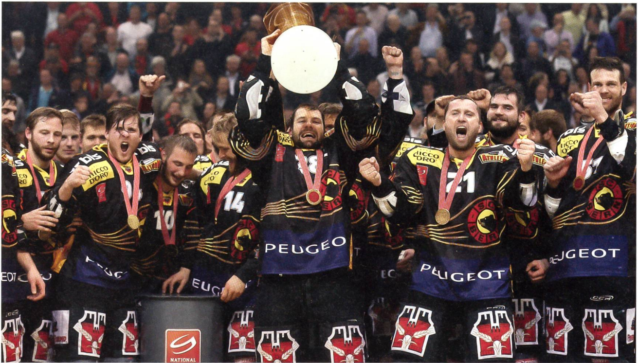
Der SC Bern wird Schweizer Eishockeymeister 2013.

samt 65 Medaillen und waren die drittstärkste Nation in dieser Rangliste. Die USA mit 104 Medaillen setzten sich wieder vor China, das 88 Medaillen errang. Herausragende Athleten waren Michael Phelps von den USA mit vier Medaillen im Schwimmen und Usain Bolt von Jamaica mit drei Medaillen in der Leichtathletik.