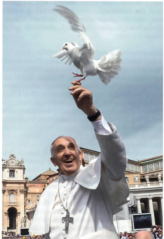
Papst Franziskus, das neue Oberhaupt der katholischen Kirche

Am 11. Februar gibt Benedikt XVI. seinen Rücktritt als Papst der Römisch-katholischen Kirche per 28. Februar 2013 bekannt. Der 1927 Geborene begründete diesen Schritt mit den fehlenden Kräften, um das anspruchsvolle Amt in seinem hohen Alter ausführen zu können. Obschon das Kirchenrecht dem Papst einen Rücktritt erlaubt, ist das in der neueren Kirchengeschichte nie vorgekommen. Der letzte freiwillige Rücktritt erfolgte im Jahr 1294 von Coelestin V. Da ein Papst auf Lebenszeit gewählt wird, löste der Schritt von Benedikt XVI. positive wie negative Reaktionen aus. Die Sedisvakanz (papstlose Zeit) dauerte nur kurze Zeit. Das Konklave der 115 wahlberechtigten Kardinäle dauerte bloss zwei Tage. Bereits im fünften Wahlgang erreichte Jorge Mario Kardinal Bergoglio aus Buenos Aires die notwendige Zweidrittelmehrheit der Stimmen. Er ist der erste Südamerikaner, der zum Papst gewählt wurde. Seine Wahl galt als grosse Überraschung. Er wählte den Namen Franziskus, gilt als bescheiden und wurde wegen seines Einsatzes für sozial Schwächere in den Slums von Buenos Aires oft als «Kardinal der Armen» bezeichnet.