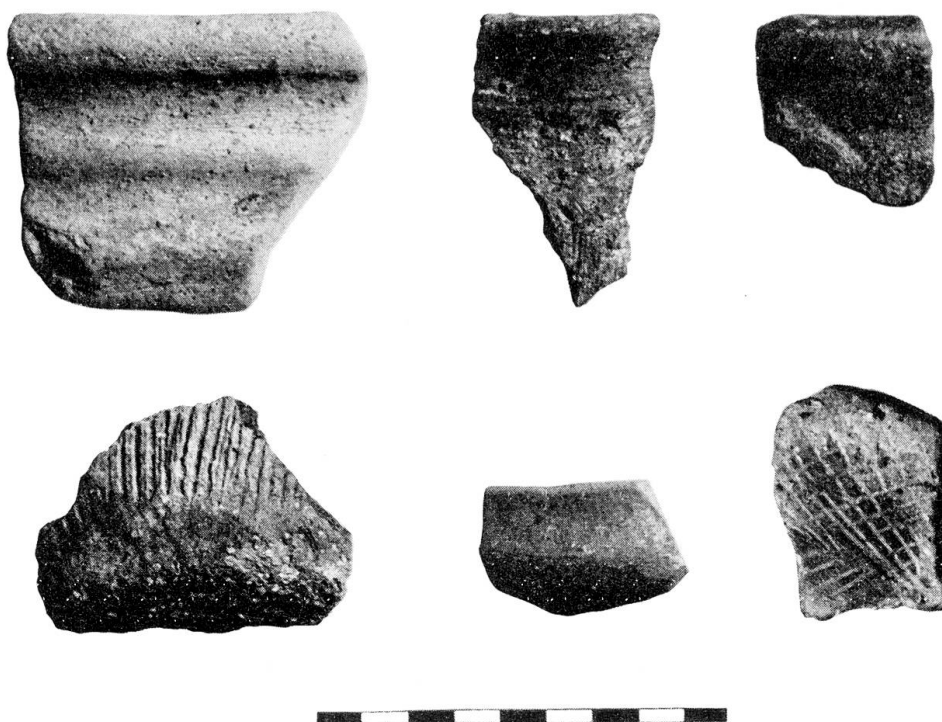
Abb. 1. Bern-Enge. Latènezeitliche Keramik. Dekore und Ränder Obere Reihe von links nach rechts vgl. Taf. 1, 12; 1, 3; 1, 7 Untere Reihe von links nach rechts vgl. Taf. 2, 23; 1, 8. M. 1 : 2

Für genauere Datierungen geben die Formen zu wenig Anhaltspunkte. Immerhin erinnert das hellgraue Schüsselfragment Taf. 1, 12 (s. a. Abb. 1, links oben) lebhaft an Formen des ausgehenden Latène C nach Reinecke.