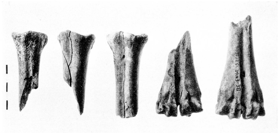
Abb. 1. Metacarpus