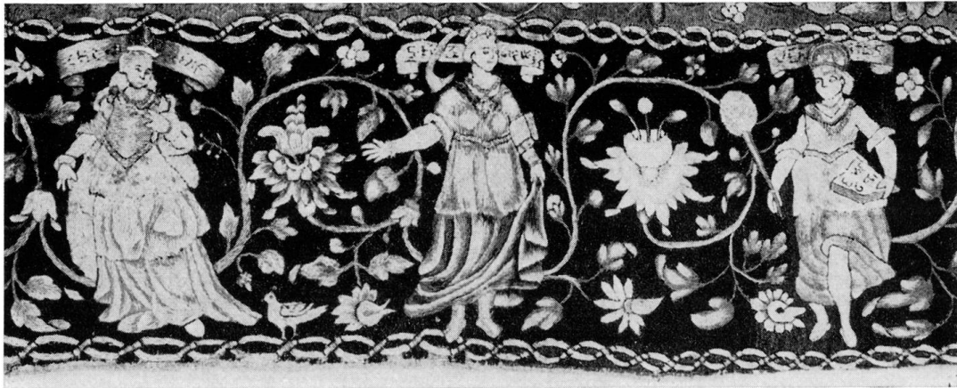
Abb. 4. Detail der Bordüre mit Hester, Susanna und Veritas

von der erbauenden Dichtung des 16. Jahrhunderts, welche viel gelesen und gar häufig ihren Niederschlag in der bildenden Kunst gefunden hat.