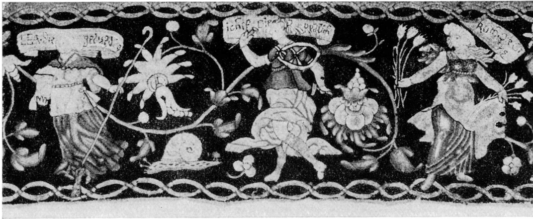
Abb. 3. Detail der Bordüre mit Lea, Johel und Ruth

Der holdseligen Mutter sein Also ein Weyb sey auch holdselig Ihrem Eheman lieblich, gefellig Als dann sie auch geliebet wirdt Holdseligkeit new lieb gebiert