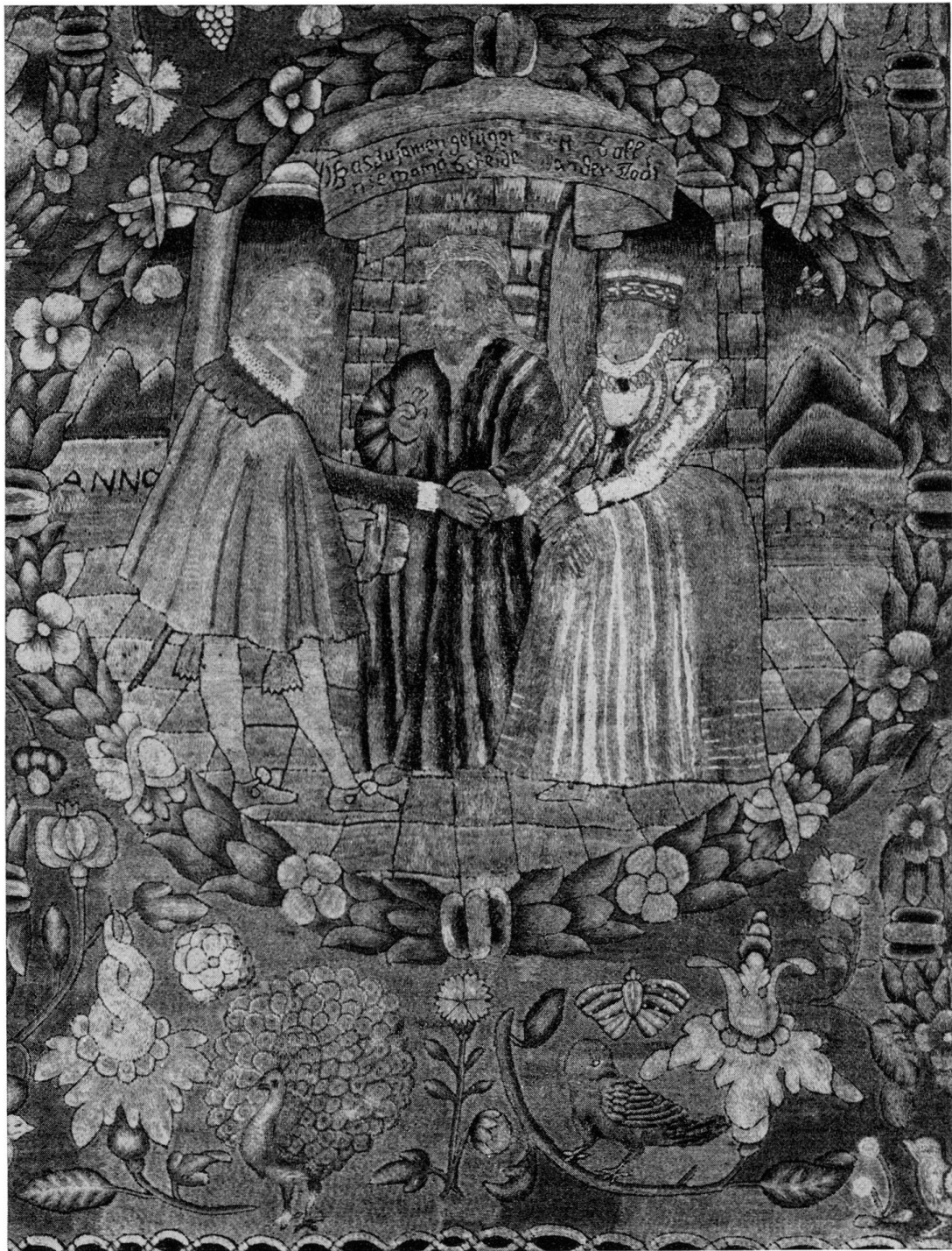
Abb. 2. Vermählungsszene aus der Wollstickerei Wagner-Wurstemberger