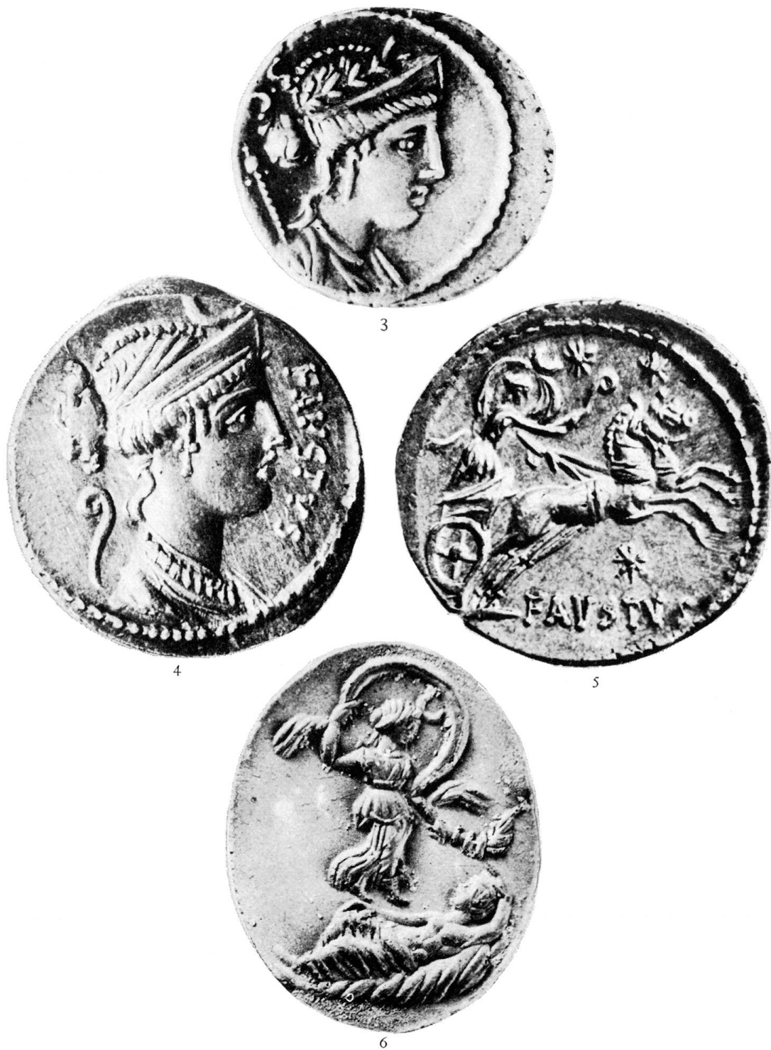
Abb. 3. Die siegreiche, weltbeherrschende Venus auf einem Denar des Faustus Sulla, 55 v. Chr.