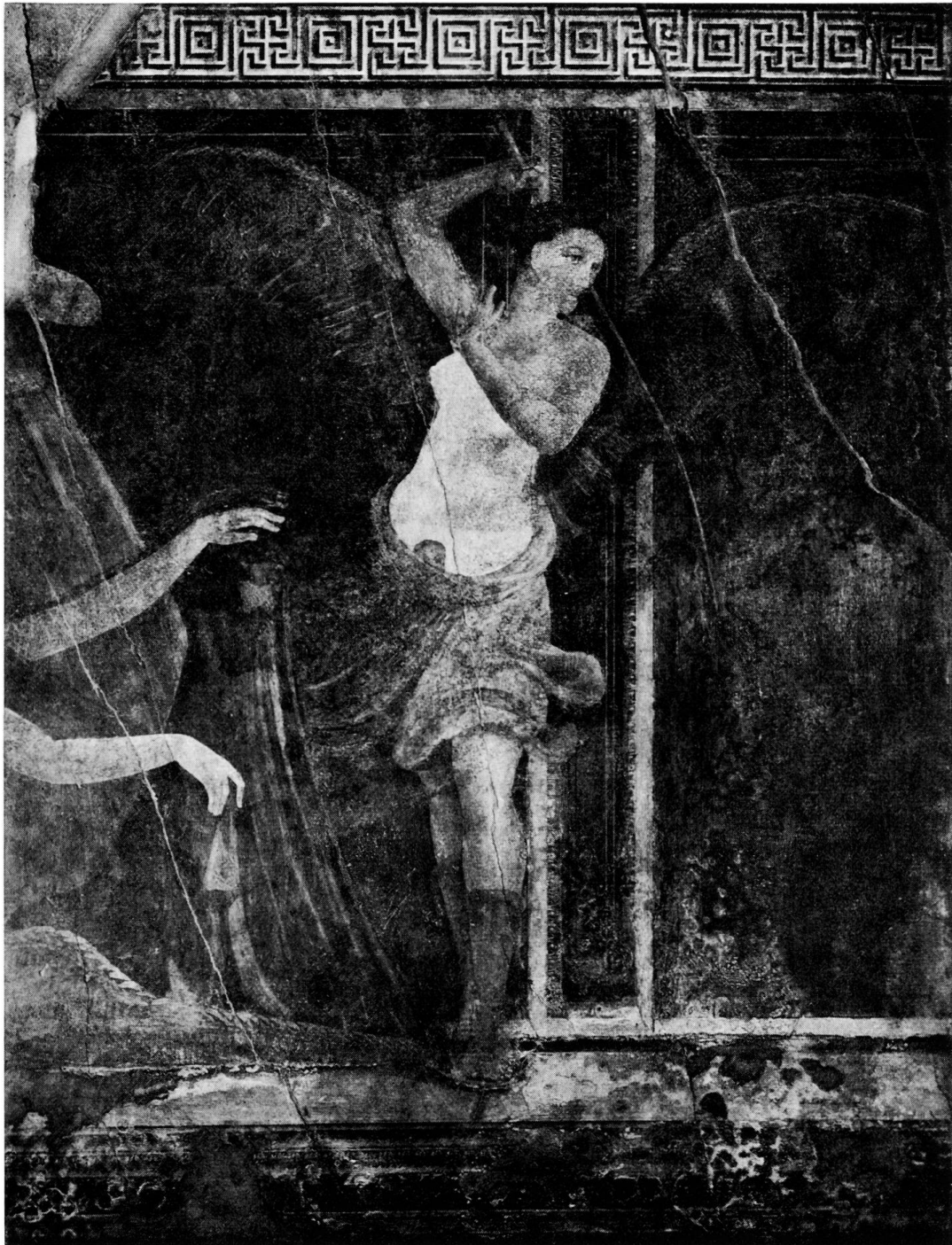
Abb. 7. Die Virgo aus dem Mysterienzyklus der Villa Igem