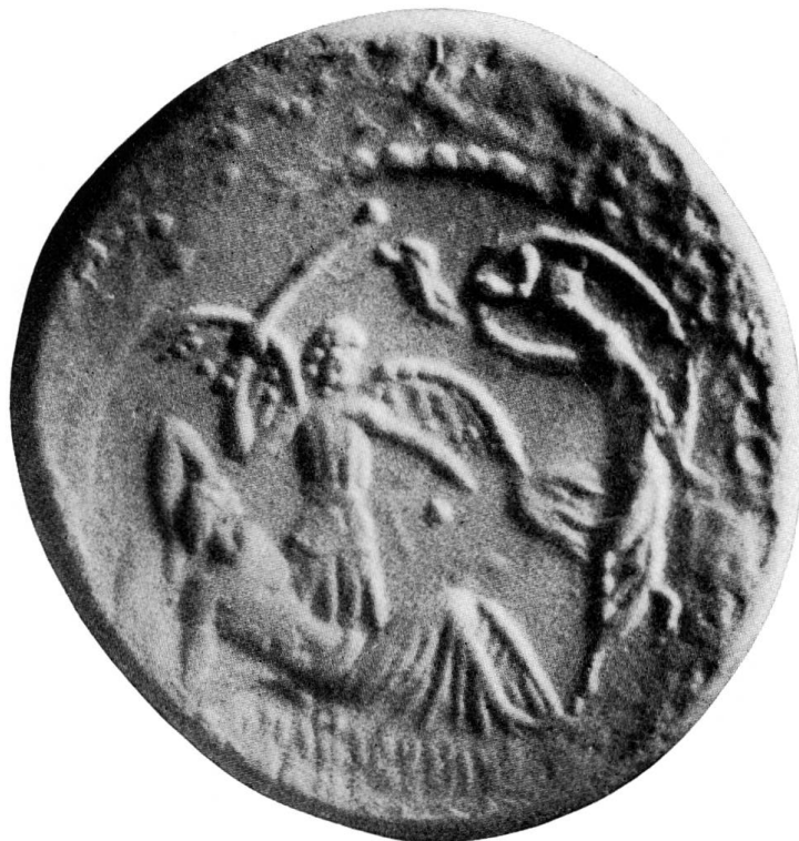
Abb. 8. Rückseite des Buca-Denars, Paris

An den Traum des Sulla, den wir besprochen haben, wurde von seinem Enkel im Januar 44 wieder erinnert, — ein Zeichen der unerhörten Duldsamkeit Caesars, der die Römer eben damals durch seine großmütige clementia mit dem von ihm angestrebten Königtum versöhnen wollte 39 . Sullas Mondgöttin erscheint auch auf dem Kleinsilber des Buca, mit einem Stern, der nicht Caesar, sondern Sulla gehört 40 .