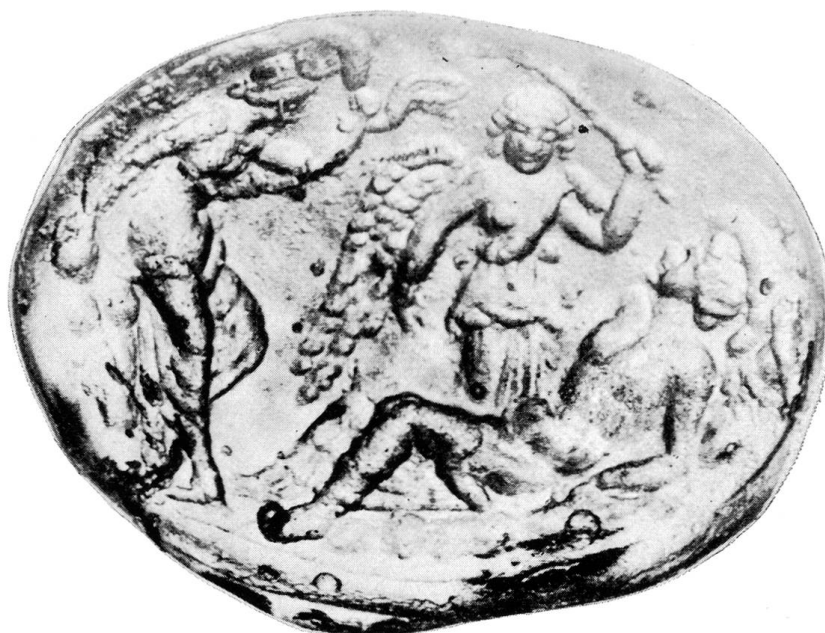
Abb. 2. Glaspaste im Nationalmuseum, Kopenhagen