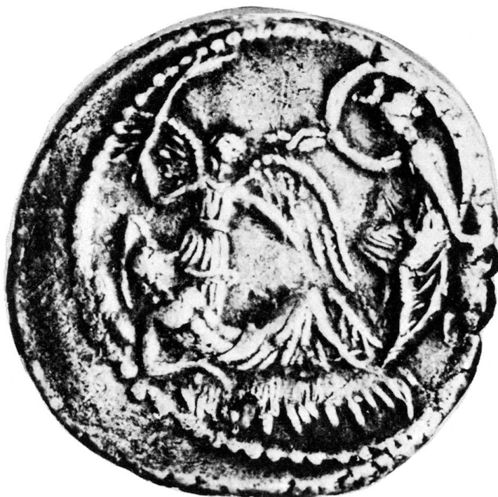
Abb. 1. Rückseite des Denars des L. Aemilius Buca im Bernischen Historischen Museum