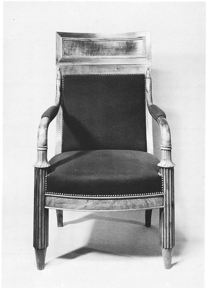
Landammannstuhl, 1832/1834, aus dem Berner Rathaus. Vgl. S. 40