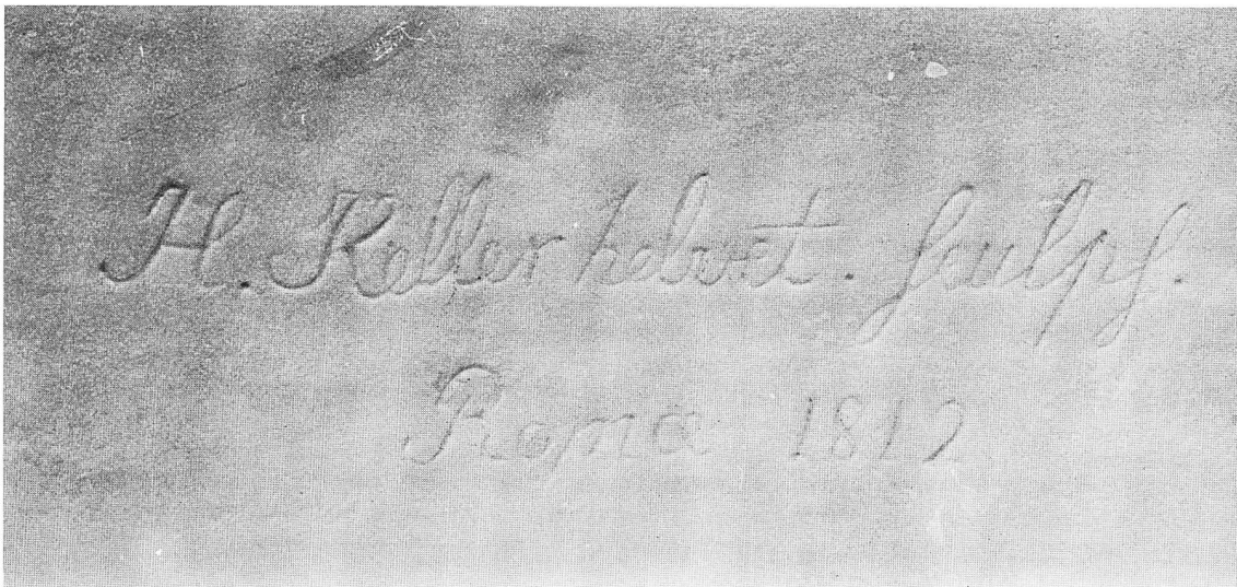
Heinrich Keller (1771–1832), Rom 1812: Kenotaph des Friedrich von Graffenried (1759–1798). Detail und Künstlersignatur. Angekauft mit einem Sonderbeitrag der Bürgergemeinde Bern. Vgl. S. 24ff. und Abbildung auf Umschlag