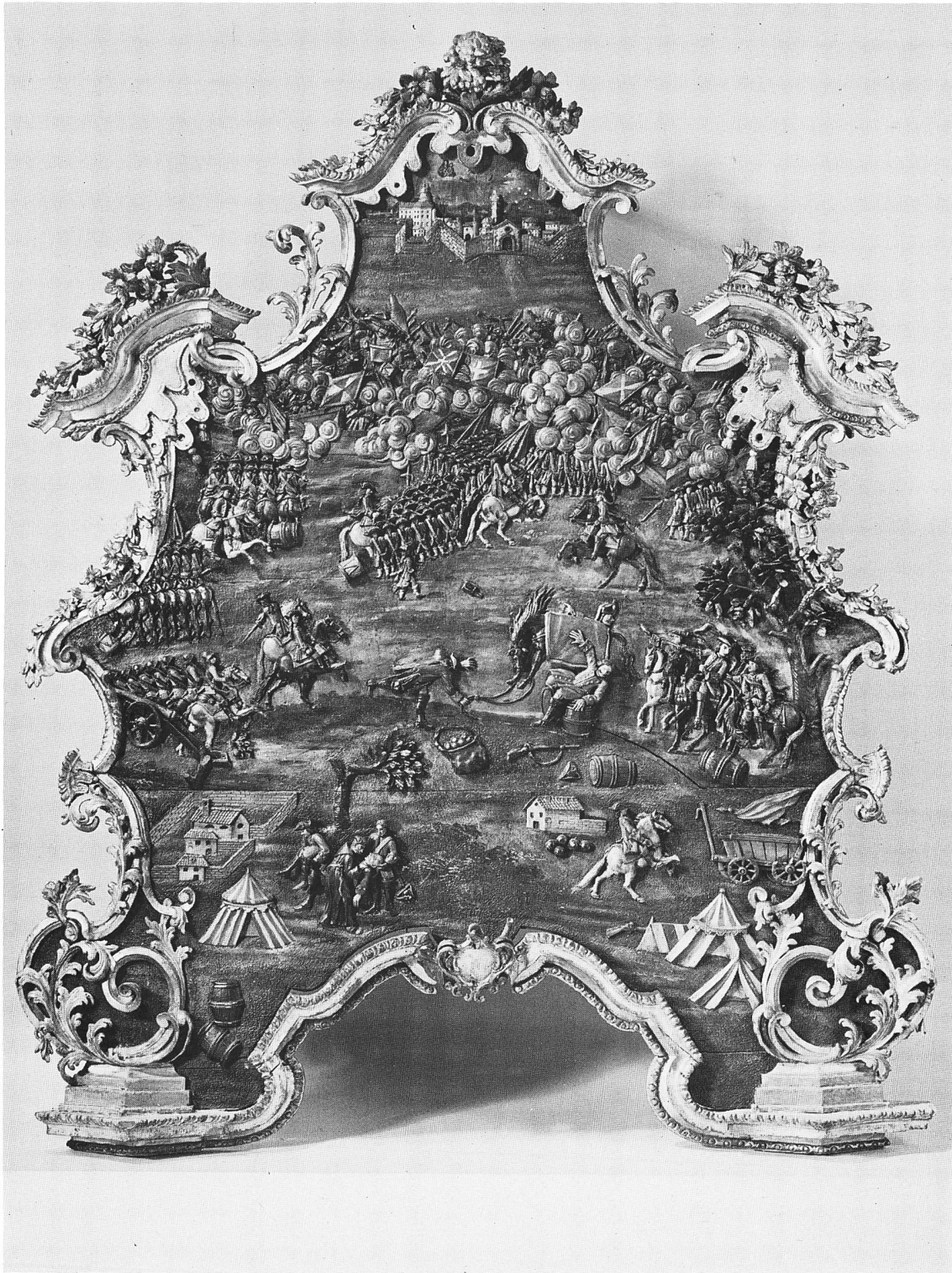
Pietro Clemente (?), Turin, um 1720: Kaminaufsatz mit Relief der Schlacht bei Turin, 1706. Angekauft mit einem Sonderbeitrag der Zunft zu Schmieden. Vgl. S. 23f.