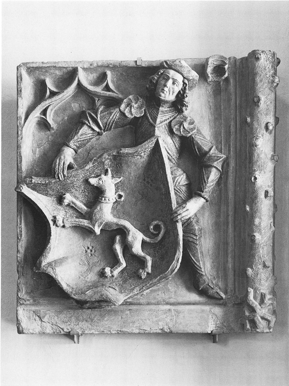
Relief mit unbekanntem Wappen vom Erkerhaus am Zeitglocken, 1505. Depositum. Vgl. S. 23