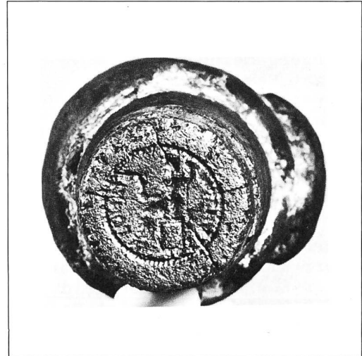
Münzstempel des Tiberius (14–37 n. Chr.). 1:1; Detail rechts 1,3:1. Ankauf mit einem Sonderbeitrag der Bürgergemeinde Bern