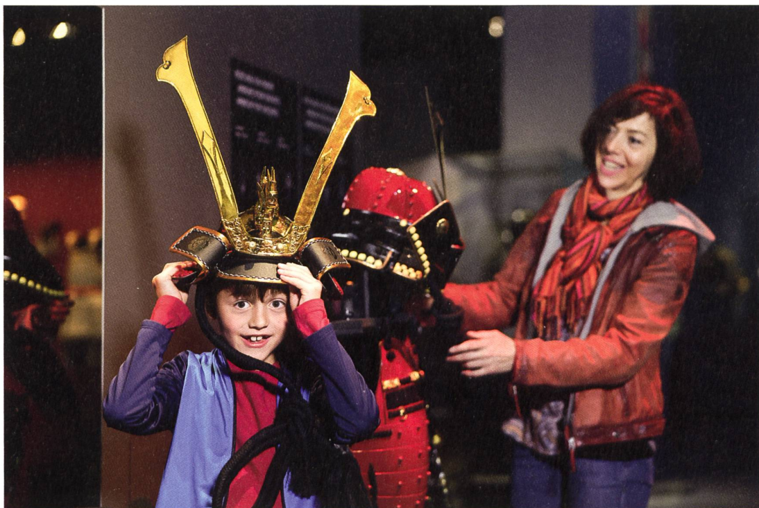
«Werde Samurai!» Anhand von Spielen, Rätseln und Mutproben entdecken Kinder die Ausstellung.