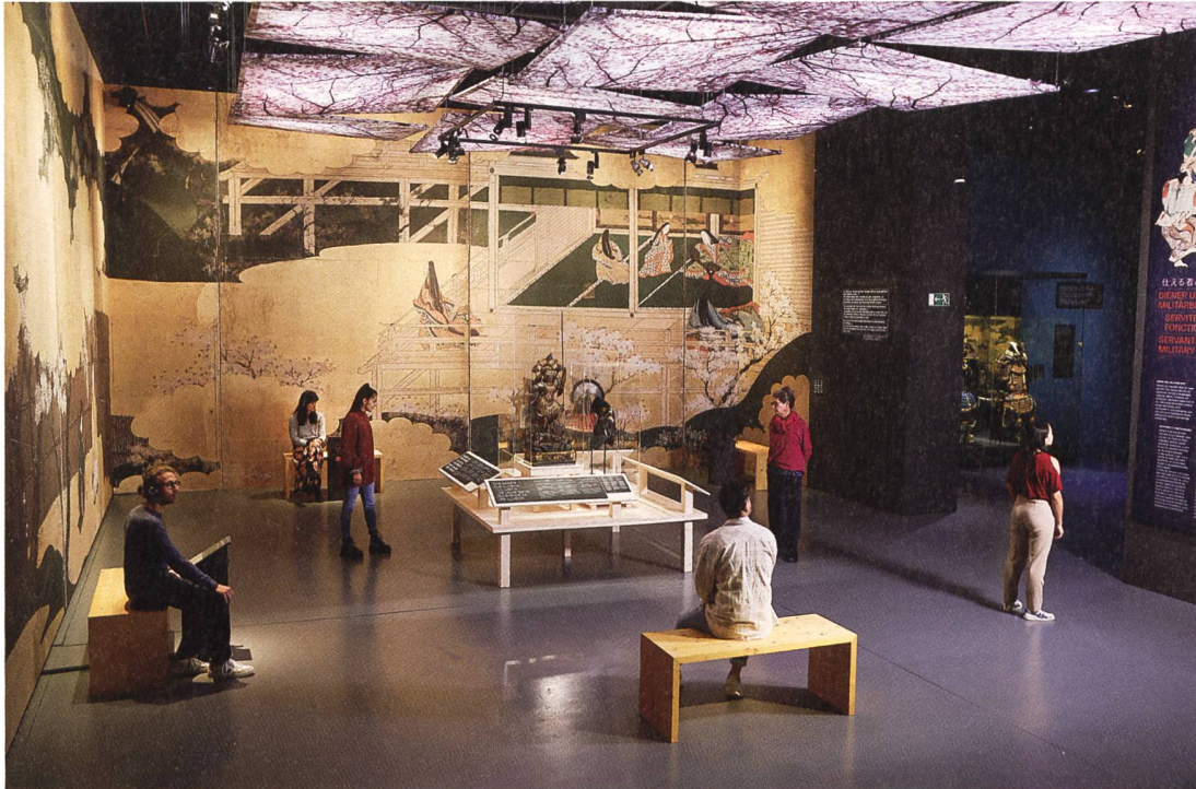
Die Ausstellung beginnt unter Kirschblüten – und endet mit einem Haiku: «Als ich zurücksah, war die Welt ertrunken – in Kirschblüten.» Chora