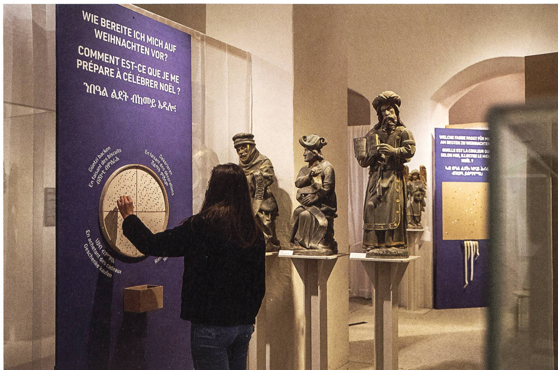
Beobachtet von den Propheten Haggai, Joel und Esra teilt eine Besucherin mit, wie sie sich auf Weihnachten vorbereitet.