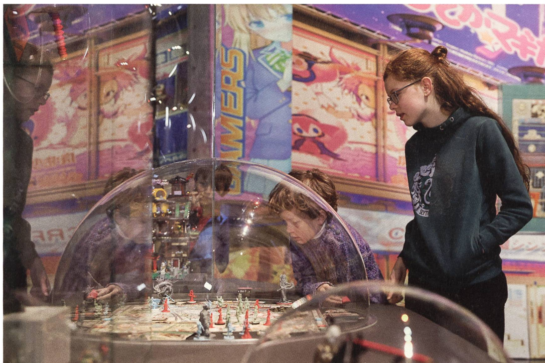
Die Samurai-Kultur und ihre Ästhetik werden weltweit von unzähligen Subkulturen aufgenommen und beständig neu interpretiert. Auch die Spielzeugindustrie bedient sich am Mythos der Samurai.

Das Besuchserlebnis war geprägt von der visuellen Opulenz der spektakulären Objekte und wurde dank zahlreicher interaktiver Entdeckungsstationen, einem 3D-Computerspiel sowie audiovisuellen Elementen zu einer sinnlichen Erfahrung. Wie fühlt es sich an, eine Samurai-Rüstung anzulegen, exotische Materialien wie Rochenhaut zu ertasten oder ein Kampfschwert in der Hand zu halten? Eine Expertenführung im Au-