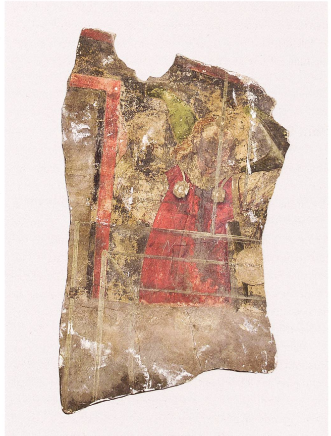
Nach über hundert Jahren aufgefunden: Erzengel Michael auf dem Fragment einer Wandmalerei aus dem Berner Rathaus (um 1450).

Im Zuge der Deakzessionierung von Objekten, die dem Sammlungskonzept nicht entsprechen, wurden 2021 insgesamt 26 513 Objekte (darunter grosse Grafik-Konvolute) entlassen, d. h. an Institutionen und Private weitergegeben oder ins Museumsarchiv übernommen. Die Planung weiterer Entlassungen nach klar definierten Kriterien wird ebenfalls über das Projektende hinaus weiterverfolgt.