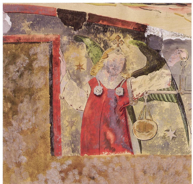
Dasselbe Stück mit dem Erzengel Michael, dokumentiert auf einer Aquarellkopie von 1897.