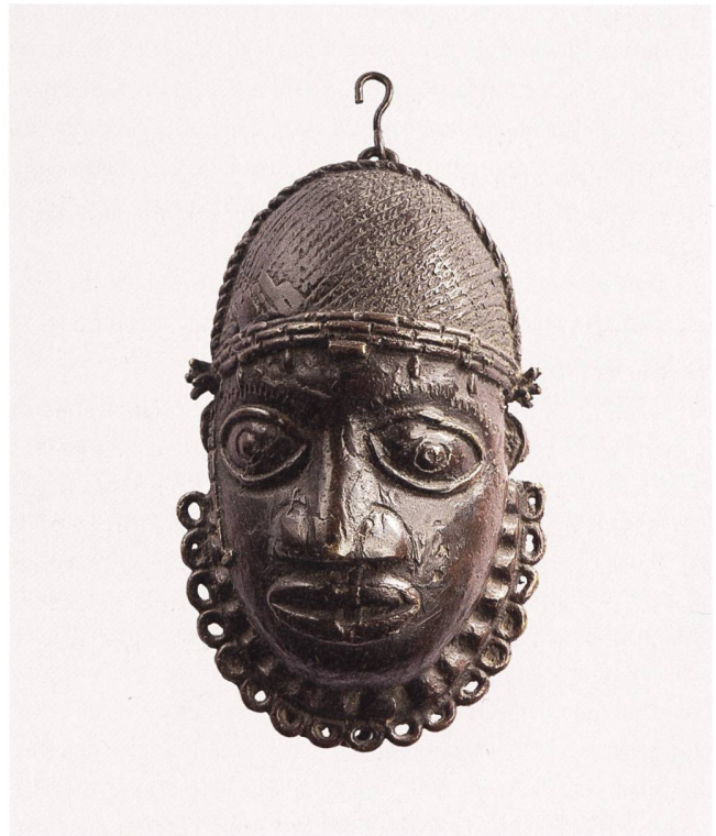
Kleine Gürtelmaske, Bronzeguss, Benin-City, 1. Hälfte 20. Jahrhundert.

Im Rahmen des vom Bundesamt für Kultur geförderten Verbundprojekts «Benin Initiative Schweiz», an dem das Bernische Historische Museum mit sieben weiteren Museen beteiligt