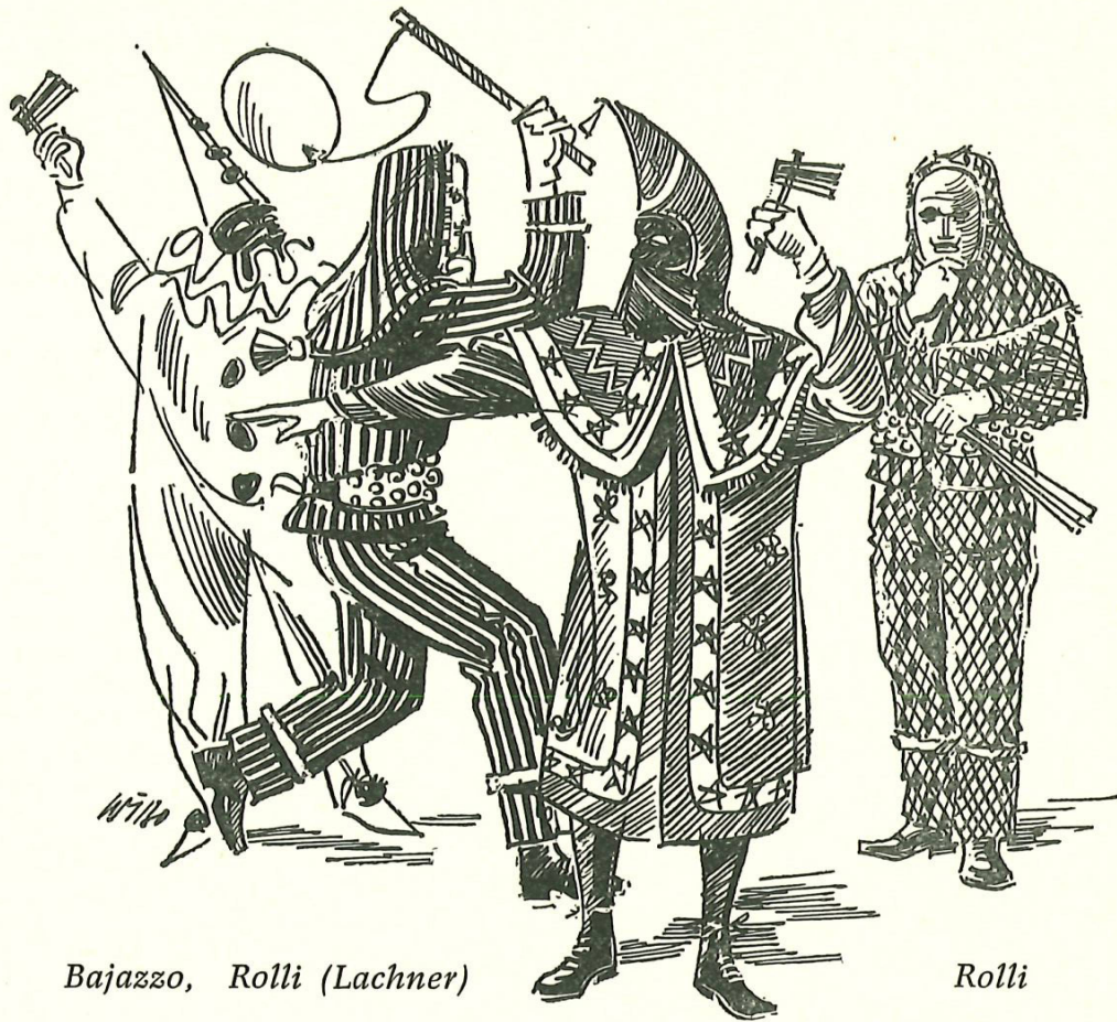
Bajazzo, Rolli (Lachner)