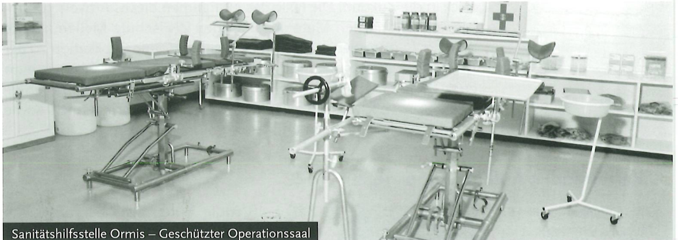
Sanitätshilfsstelle Ormis – Geschützter Operationssaal