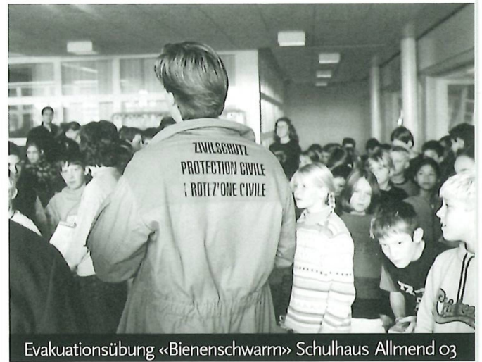
Evakuationsübung «Bienenschwarm» Schulhaus Allmend 03

Die Einführung der Zivilschutzregion Meilen per 1. 1. 2004 bildete den Anlass zum folgenden historischen Abriss über den Zivilschutz in Meilen.