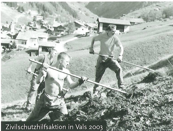
Zivilschutzhilfsaktion in Vals 2003