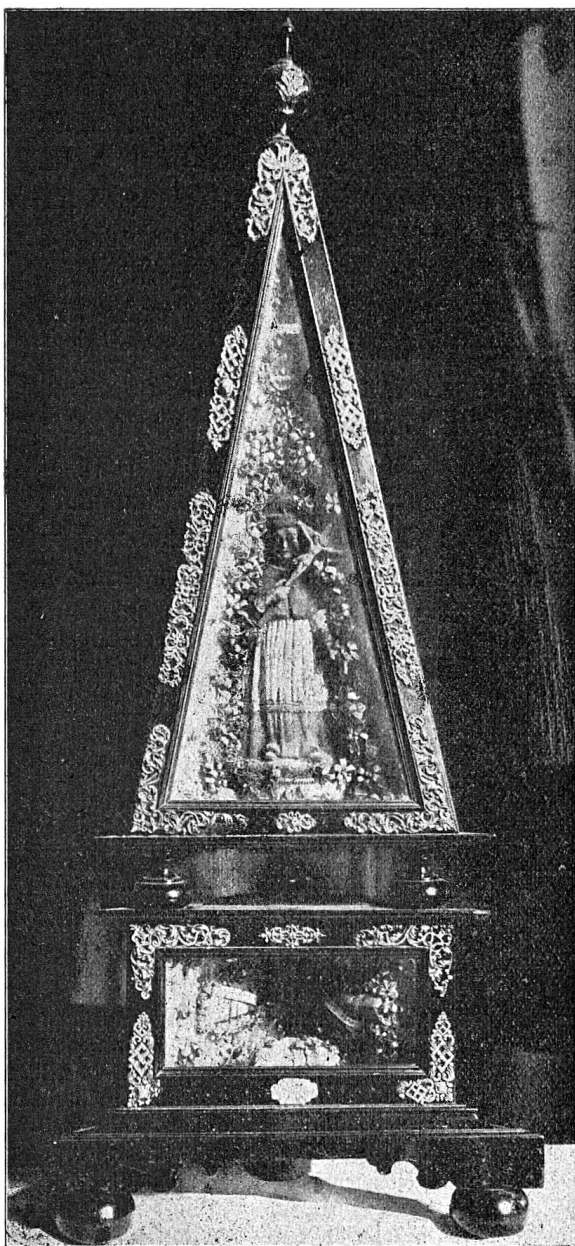
Reliquienpyramide der Pfarrkirche Altdorf. Mit einer Wachsfigur des hl. Karl Borromeo.