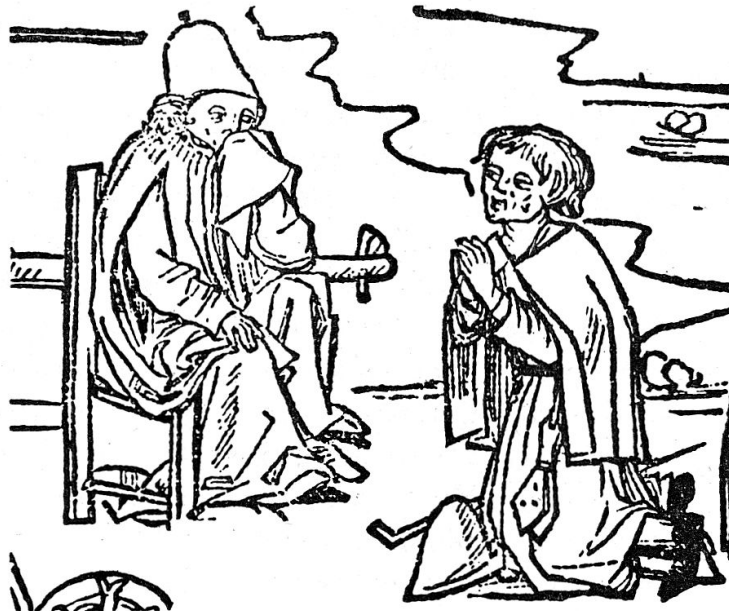
Ein Aussätziger, mit angehängter Lepra-Klapper, beichtet. Der Priester hält sich ein Tuch vor den Mund, als Schutz gegen Ansteckung. - Holzschnitt aus dem 15. Jahrhundert.

vogt vor. Zur Besorgung der Wäsche und des Bettzeuges war eine weibliche Person bestimmt. In «Siechenhäuser in der Schweiz» von Arnold Nüscheler, Archiv für S.G., 15. Band (1866), steht geschrieben, dass das Siechenhaus des Kantons Uri im nördlichen Teil des Fleckens Altdorf sich befunden haben und in der zweiten Hälfte des 18. Jahrhunderts entstanden sein solle. Woher diese Angaben, die sicherlich falsch sind, stammen, weiss man nicht. Vielleicht besteht hier eine Verwechslung mit dem Pest-Absonderungshaus. Das Siechenhaus stand nach Josef Gisler («Das ehemalige Siechenhaus in Uri», Histor. Neujahrsblatt 1897) auf dem Siechenmätteli, 1 km südlich vom Flecken Altdorf entfernt, an der Landstrasse, links in der Nähe der Schächenbrücke auf dem Gebiete der Gemeinde Bürglen. In seiner Nähe war der Richtplatz, wo der Galgen hing. Es trifft auch hier die interessante Erscheinung zu, dass die Hälfte der in der Schweiz bestehenden Siechenhäuser sich in der Nähe des Richtplatzes befanden, so in Schwyz, Stans, Sarnen, Zug, Schaffhausen etc. Die Richtstätte galt damals als verfemte Gegend, die von der Bevölkerung allgemein gemieden wurde. Da