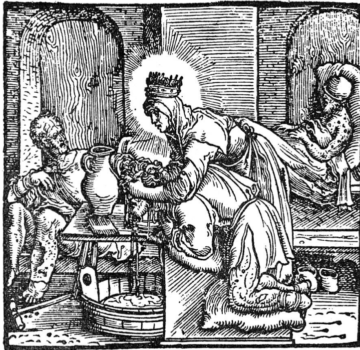
Die hl. Elisabeth von Thüringen pflegt Aussätzige. Holzschnitt von Hans Weiditz in «Sanctorum et Martyrum Christi Icones», Frankfurt 1551.