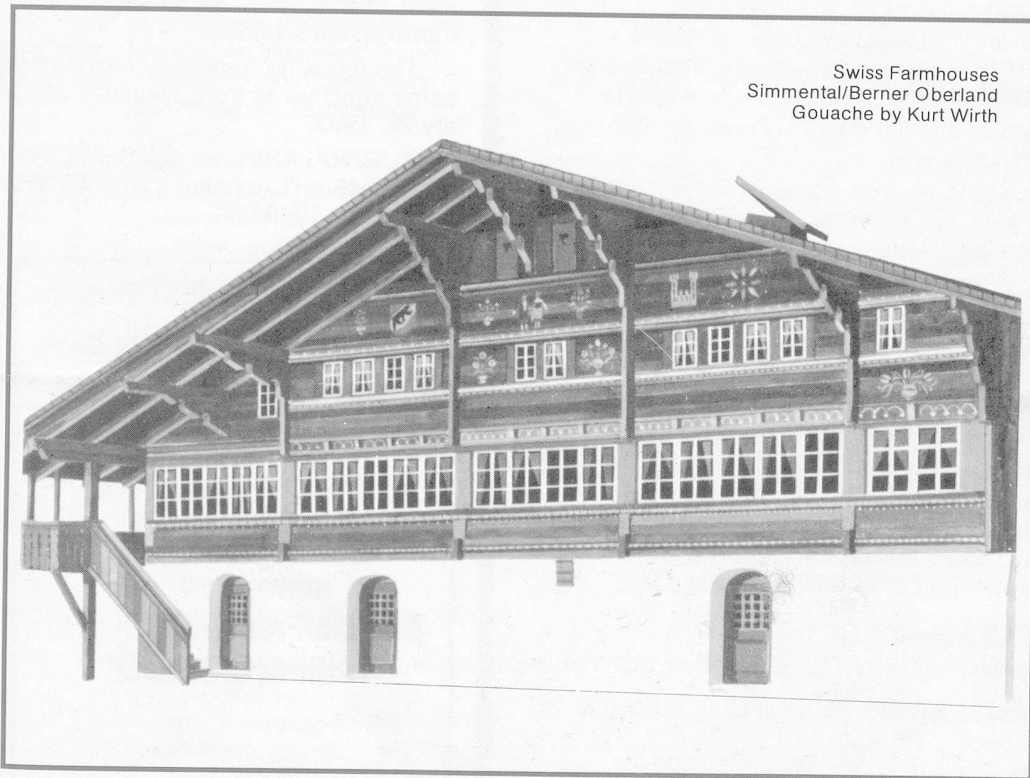
Swiss Farmhouses Simmental/Berner Oberland Gouache by Kurt Wirth

(Registered at the G.P.O. Wellington as a Magazine) Monthly Publication of the Swiss Society of New Zealand (Inc.) Group New Zealand of the Helvetic Society