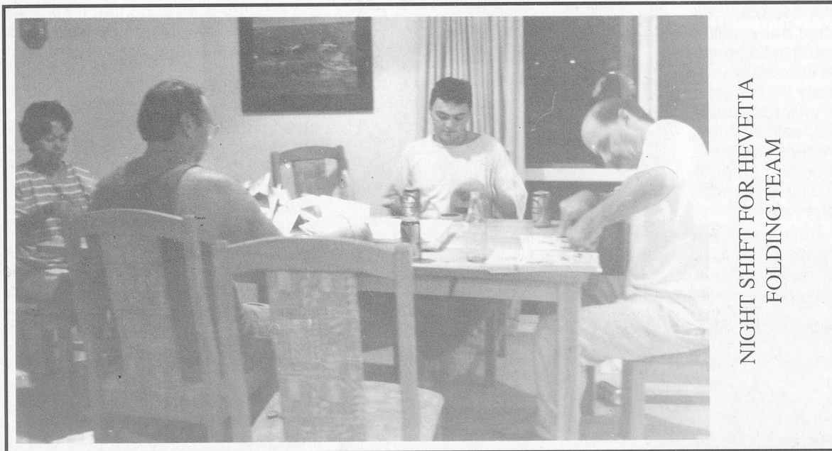
NIGHT SHIFT FOR HEVETIA FOLDING TEAM