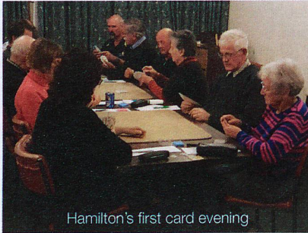
Hamilton's first card evening