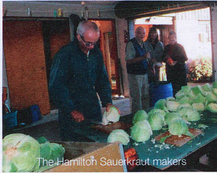
The Hamilton Sauerkraut makers