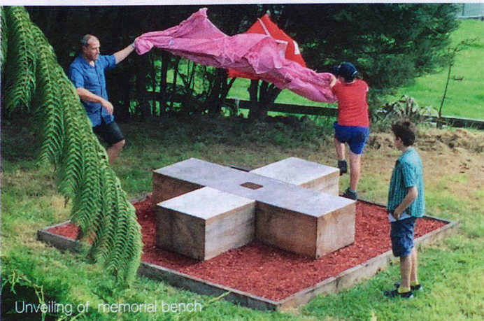
Unveiling of memorial bench