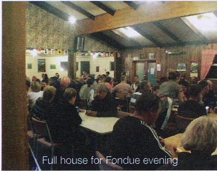
Full house for Fondue evening