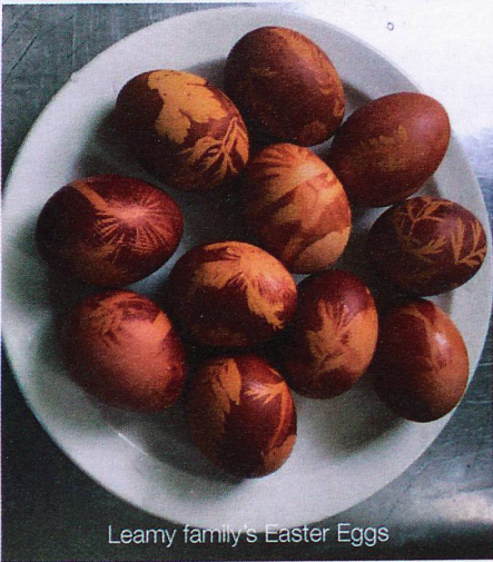
Leamy family's Easter Eggs