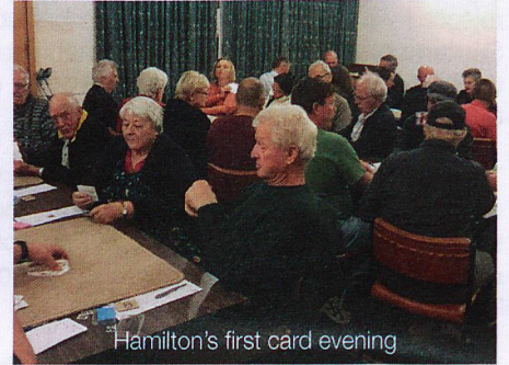
Hamilton's first card evening