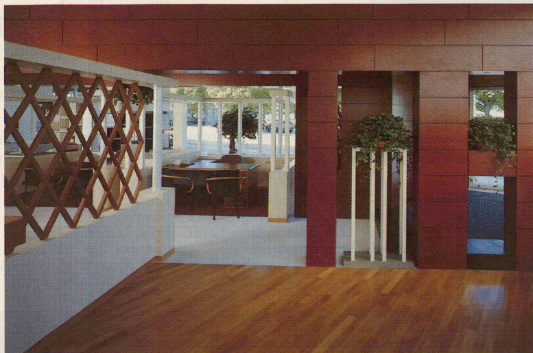
Sottsass' zweiter Laden in Zürich: Crosszügigkeit auf engem Raum.