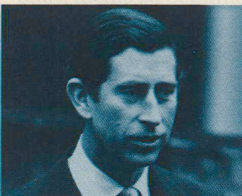
Prinz Charles von England: Ambitionen als Planer.

Reaktionäre englische Politiker haben seit geraumer Zeit ein neues Feindbild: Charles, 39, «Prince of Wales», läuft ihnen als königlicher Populist etwas allzusehr nach links aus dem Ruder.