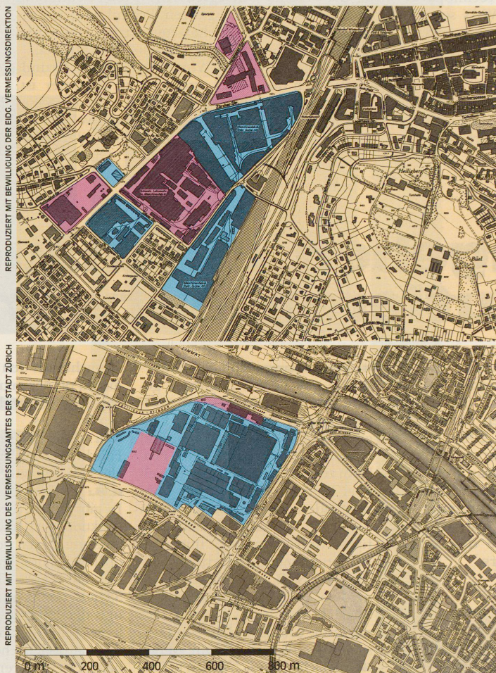
Oben: das Sulzergelände in Winterthur mit 250 000 Quadratmetern in unmittelbarer Nähe des Bahnhofs (blau: neue Nutzung geplant). Unten: das Escher-Wyss-Areal in Zürich mit 160 000 Quadratmetern zwischen Limmat und Bahnlinie.

Noch vor sieben Jahren sind in den Winterthurer Werkstätten 4 Millionen Stunden pro Jahr gearbeitet worden; heute ist die Produktion auf 1,5 Millionen Stunden gesunken. Kein Wunder, dass der Konzern jetzt daran denkt, sich auch räumlich etwas