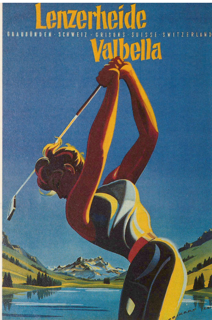
Die Werbe-Golferin ist die Ausnahme: Der Rasensport zieht vorwiegend Männer an.

ein Dutzend zusätzliche Parcours herum, im Wallis (heute 3 Plätze) wurden schon über 20 neue Standorte genannt.