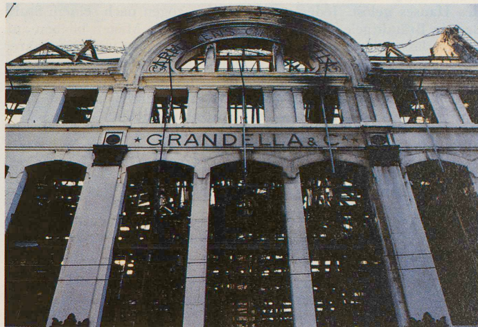
Das ausgebrannte Warenhaus Grandella (links und oben) im Lissaboner Altstadtviertel Chiado ist Teil der Unterstadt aus dem 18. Jahrhundert und zum «Kulturgut von nationalem Interesse» erklärt.