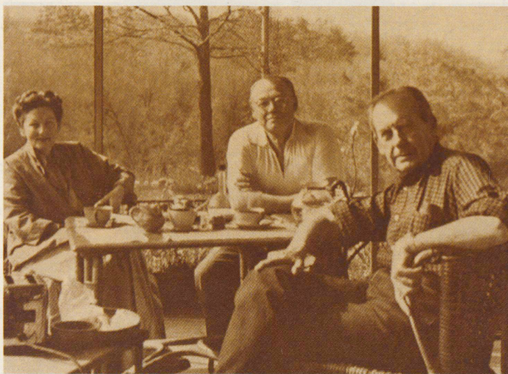
Ilse Gropius, Sigfried Giedion und Walter Gropius in Lincoln, USA, um 1952.

D urch die entscheidende Vermittlung Walter Gropius' wird Giedion um 1938 als Gastprofessor nach Harvard/USA berufen. Seine Charles Eliot Norton Lectures erscheinen drei Jahre später in Buchform: «Space, Time and Architecture» (1941). Dieses Werk zählt zu den erfolgreichsten