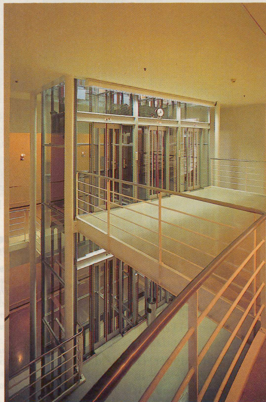
Der Glaslift im Berner Amthaus: Aus der Situation bedingter architektonischer Dialog zwischen dem renovierten Altbau und dem Erweiterungsbau aus heutigen Materialien.

Amthaus 1979 sind in der Schweiz weit über hundert Lifte der durchsichtigen Art entstanden. So viele, dass Architekt Consolascio dahinter nicht nur Gestaltungswillen, sondern eine wahre Gestaltungswut wittert: «Alles und jedes muss heute «gestaltet» werden, vom Aussenlift an einer Geschäftshausfassade, der mir wie Patisserie vorkommt, bis zur trapezförmigen Visitenkarte, die damit ihre Funktion völlig verliert.» Auch für Denis Roy vom «Atelier 5», das mit dem Berner Amthauslift das Signal für den gläsernen Boom gab,