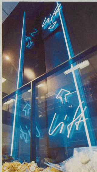
Spektakuläre Neonröhren erfüllen eine funktionsfremde Aufgabe: Locken statt Liften.

Grellblaue Neonröhren, Richtungs- pfeile und die Leuchtschrift «Lift»: Im Coop-Supermarkt im Luzerner Löwencenter muss der Lift auf sich selber aufmerksam machen, als Schlagzeile, dort, wo eigentlich das «Angebot des Tages» anzupreisen wäre. Weil hier für eine Treppe zum ersten Stock (der Laden ist nur zwei- geschossig) der Platz fehlte, ent- schied sich Architekt Hans Zwim- per für einen «Kundenhubstapler». Zwischen den vollgestopften Ver- kaufsregalen kommt das Licht- und Liftspiel allerdings nicht so richtig zur Geltung. Auch täuschen die ver- tikalen Leuchtröhren, unterstützt durch den Pfeil nach oben, eine Hö- hendimension vor, die es gar nicht gibt. Problematisch zudem die hori- zontale Orientierung des Kunden: Dass der Zugang zum Lift rückwärts – im Einkaufswagenlalom zwischen Schokolade und Waschpulver – ge- sucht werden muss, sagt ihm die spektakuläre Vorderseite nämlich nicht.