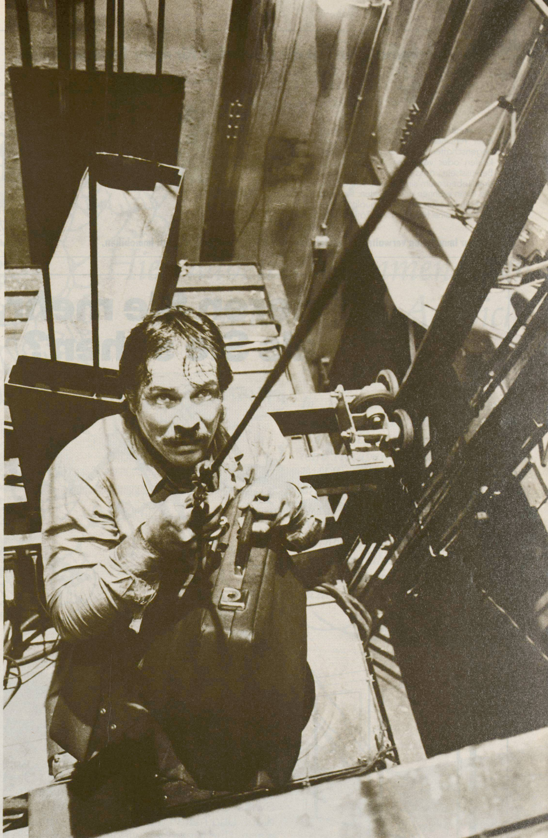
Götz George auf dem Liftdach im Thriller «Abwärts»: Eine Situation, wie Liftprofis sie für unwahrscheinlich halten: Sicherheit im Griff.

Strenge Sicherheitsvorschriften, entsprechend gebaute Aufzüge, zuverlässige Monteure: «Technisch scheint das System Lift heute vollendet», konstatieren Simmen/Drepper in ihrem Buch. Die «obskuren Gefühlseindrücke» sind damit in die Obskurität der Kinosäle verbannt. Dort allerdings kann die Liftsitua-