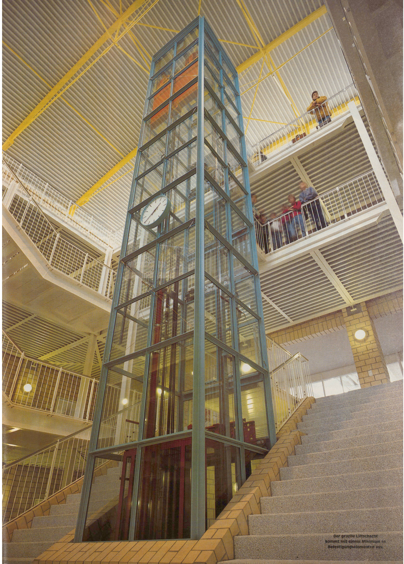
Der grazile Liftschacht kommt mit einem Minimum an Befestigungselementen aus.