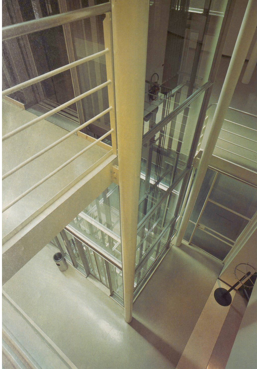
Der gläserne Liftschacht im Berner Amthaus macht nicht nur optisch einen schwerelosen Eindruck.