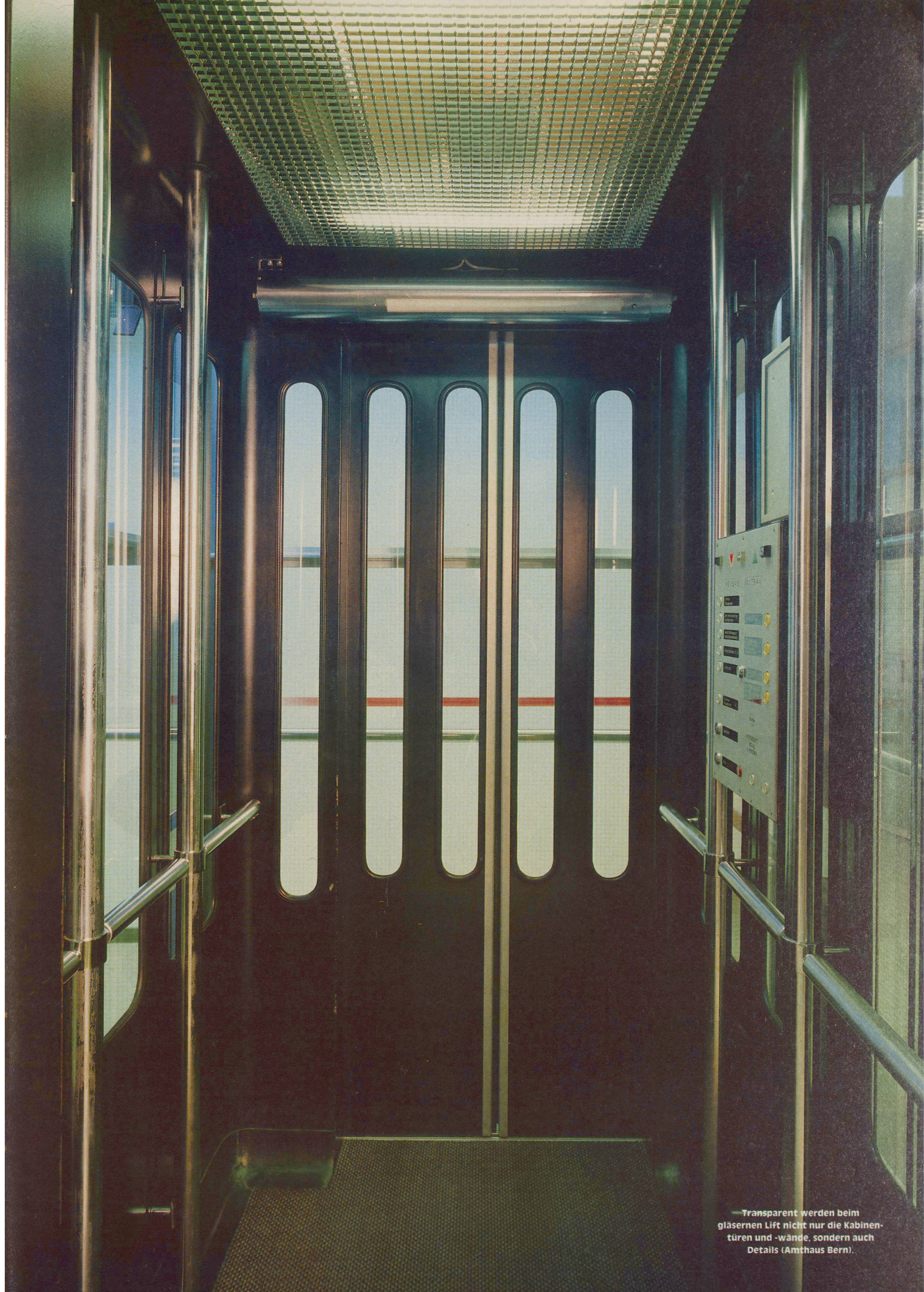
Transparent werden beim gläsernen Lift nicht nur die Kabinentüren und -wände, sondern auch Details (Amthaus Bern).