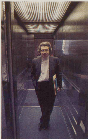
Der Lift als spielerisches Element: Mario Botta scherzt mit dem Licht und mit den Leuten.

In einem Bankverwaltungsgebäude wie dem der Luganeser Banca del Gottardo erfülle der Lift eine dienstliche und keine öffentliche Funktion, erläutert Botta. Deshalb handle es sich auch um einen «traditionellen» Aufzug, eingepasst jedoch in die Ornamentik des ganzen Baus. Das horizontale Streifenmuster, das sich in verschiedenen Materialien immer wieder findet, ist in abwechselnd poliertem und mattiertem Chromstahl abgewandelt. Spieglein, Spieglein an der Liftwand, zum Zeitvertreib: Das Warten auf den Lift, diesen für viele peinlichen Moment, habe er spielerisch überbrücken wollen. «Hier können die «Ragazze» noch rasch ihre Maquillage korrigieren