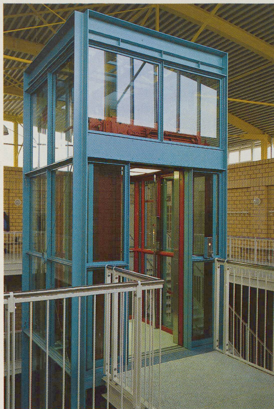
Geometrie, Physik und Konstruktion werden nachvollziehbar, logisch: Der Lift ist mehr technischer Anschauungsunterricht als Transportmittel.

Auch das kann spüren, wer's merkt: Der Liftturm wächst aus einem massiven Keil heraus, der wie ein Klotz frei im Raum steht und zugleich die Treppe zum ersten Stock bildet. Ein Klumpfuss für das grazile Schachtgerüst, auch visueller Gegensatz dazu, aber nicht nur: Dank diesem «Fundament» benötigt der Schacht an den oberen Etagen nur noch je zwei lediglich stabilisierende Befestigungen. Klar,