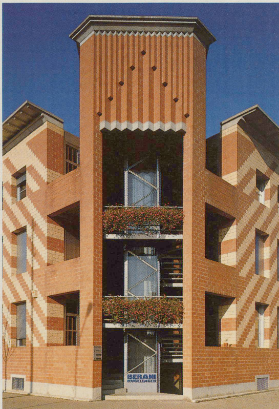
Der Liftturm, Aufsehen erregend, tritt dem Besucher als erstes gegenüber. Eingangstüren und Treppen stehen im Schatten, der Lift wird zur Visitenkarte nicht nur des Gebäudes, sondern auch der Firma.

bausteinen endet. Eine lichte Röhre aus zusammengeschraubten Winkeln, feuerverzinkt belassen. (Beim näheren Besehen der exakten Schweissnähte erkennt: sichtbare Liftschächte verlangen ein aufwendigeres Finish als der übliche Schacht.) Die Querverstrebungen der Schachtwände ergeben übereinandergereihte Prismen, darin Scheiben aus Sicherheitsdrahtglas. An den verschiedenen Kanten zitieren ineinander verschachtelte Winkelkombinationen die Backsteinwinkel der Hauswand.