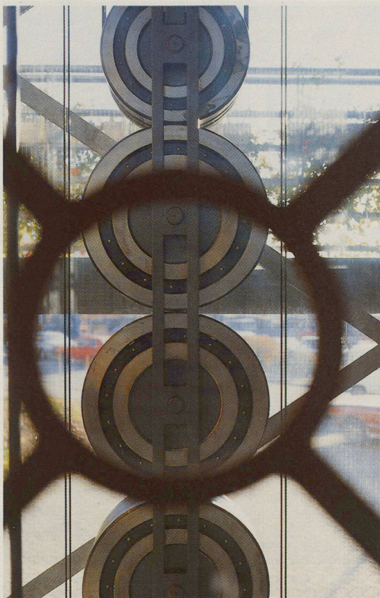
Kugellager als Gegengewicht am Lift in der Kugellager-Handelsfirma, gesehen durch das runde Fenster in der Kabinentüre: Der Architekt hat signethaft jene Form aufgenommen, die den Betrieb in seinem Bau prägt.

Im Treppengeviert (Treppenstufen aus Stahlgitter) das «objet mécanique»: der Lift. Ein schmaler, quadratischer Turm, der vierkantig aus dem in Beton gefassten Kellergeschoss ragt und zuoberst einen Meter unter dem lichteinlassenden Dach aus Glas-