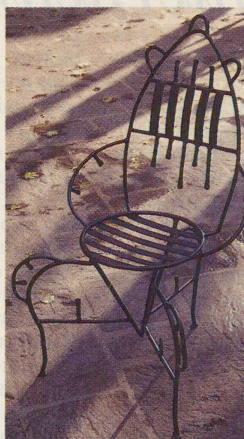
Die Möbelindustrie setzt auf die 200-Jahr-Feier der Französischen Revolution: «Chaise Marie Antoinette» von Eric Schmid.

Der 200. Jahrestag des Sturms auf die Bastille ist schliesslich ein Ereignis, das allen Erdbewohnern wieder einmal vorführen sollte, wo die Wiege des modernen Lebens liegt. Engagierte jeglichen Kolort werden sich an dieser hehren Aufgabe – und am Geschäft – beteiligen. Und so ist es ei-