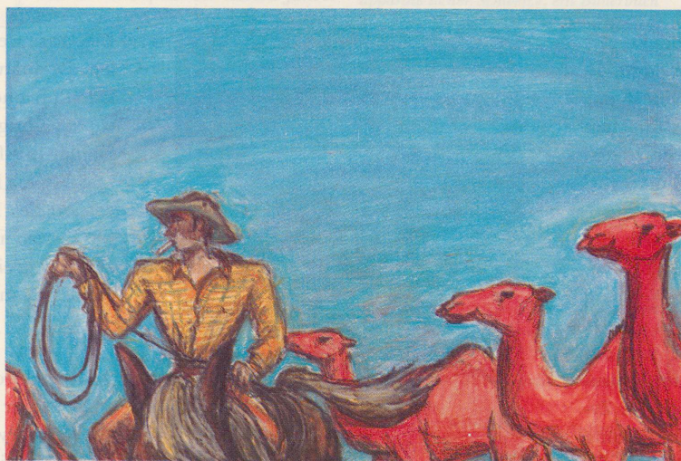
Wir treffen uns neuerdings in der gemeinsamen Terra cognita, das Produkt und wir. Dort, wo wir beide nichts zu suchen haben.

Es gibt keine Elite, keine Minderheit und keine Aussenseiter in der Totalen des Mittelstandsglücks, weil da alle mit allen identisch sind. Pardon – auch Sie, Madame, sind die Omi des sprudelnden Seniorenwesens und das «happy baby», und Sie, Esquire, sind der Ferdi Kübler der Versicherungen und der Daddy der reparierenden Munterkeit. Alle passen fugenlos in