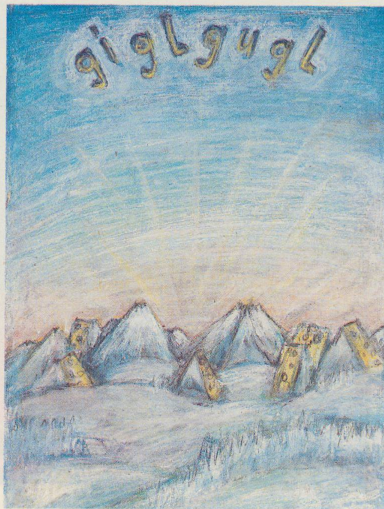
Auf dem gesunden Zahnschmelz von Elger, Mönch und Chäteller erfüllt sich das Schwilzer Qualitätsglück.

Das heisst: Wir treffen uns neuerdings in der gemeinsamen Terra cognita, das Produkt und wir. Dort, wo wir beide nichts zu suchen haben, und die Ware weiss, als Produkt ist sie dort stärker. Hinterm Lianengeschling am