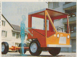
Der Aebi-Transporter, gelbe Version: ein Produkt des Gestalters Ludwig Walser. Seite 36