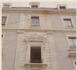
Das sanft renovierte Quartier des Grottes in Genéve. Seite 78