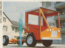
Der Aebi-Transporter, gelbe Version: ein Produkt des Gestalters Ludwig Walser. Seite 36