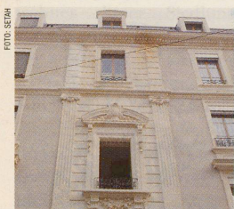
Das sanft renovierte Quartier des Grottes in Genf. Seite 78