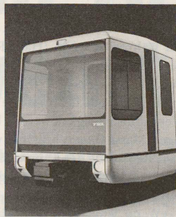
Ganz oben: Claude Frossard (links) und Antoine Cahen in ihrem Atelier an der Place du Nord in Lausanne. Oben: Modell für die neue Südwestlinie der Lausanner «Metro». Unten: Hängesystem für Vitrinen mit integrierter Beleuchtung im Spielzeugmuseum La Tour-de-Peilz.

«Der schwierige Stand des Industrial Designers ist kein Problem der westlichen Schweiz, sondern der Schweiz