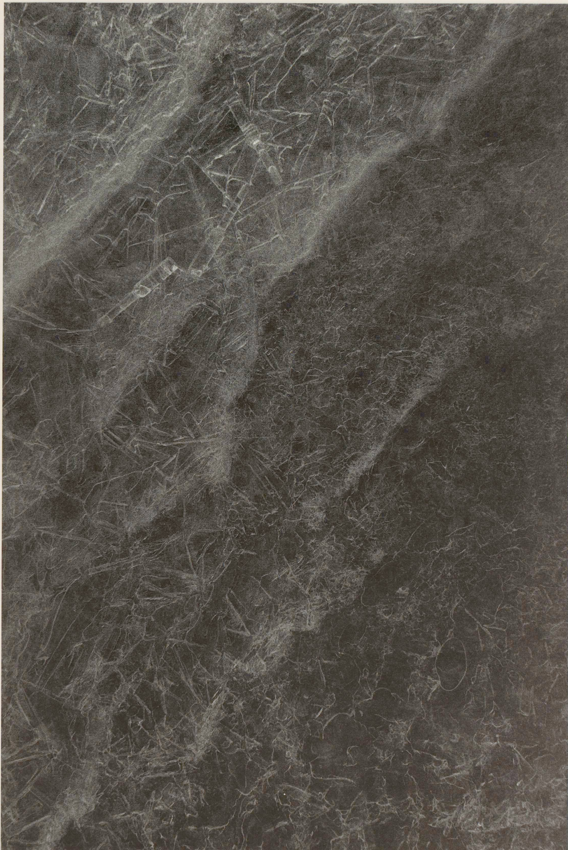
CHEMIE II, 1989

Die Ulmer Politik des Industrieopportunismus und des Verzichts auf künstlerischen Anspruch und Gestus hat zwangsläufig eine Umbenennung der gestalterischen Praxis zur Folge: Gestaltung heißt jetzt Design. Dieser Wechsel des künstlerischen Handlungsmodells