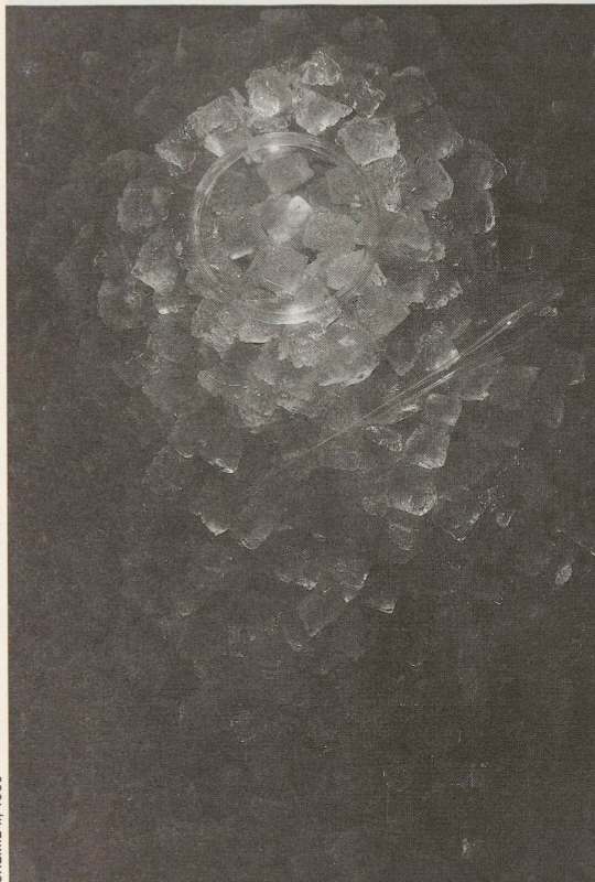
CHEMIE II, 1989

Projekt in der deutschen Provinz: In Weimar entsteht das Bauhaus, die erste institutionalisierte Forschungs- und Ausbildungsstätte für die Theorie und Praxis der konstruktivistischen Gestaltungslehre. Die am Bauhaus tätigen Maler, Plastiker, Fotografen, Filmer und Architekten untersuchen systematisch die Möglichkeiten der Anwendung der avantgardistischen Formensprache des Konstruktivismus auf Gegenstände der «realen Werkwelt» (Walter Gropius) und der Produktion ihrer Schöpfungen unter zeitgemässen Bedingungen der Technik. Die Idee des Bauhauses verfolgt hartnäckig die ästhetischen Zielsetzungen des Projekts Moderne: die vollständige Entrümpelung der deutschen Wohnzimmer vom darin gestapelten monarchistischen, nationalistischen, religiösen und akademistischen Kitsch. Als Bündnispartner, als Financier dieses Unternehmens fungiert das liberale, dem technischen Fortschritt gegenüber aufgeschlossene Bildungsbürgertum. Es liegt in der politischen Natur der Sache, dass das Unternehmen Bauhaus vom Nazifaschismus torpediert wird.