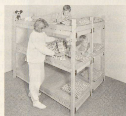
Mehrzweckhürde für Kind und Kegel, schockgeprüft

risch wird? Die Stadt Zürich hat im Hinblick auf 1995 bereits jetzt in Oerlikon eine Beratungsausstellung mit Liegestellen und Notaborten eingerichtet. Dort bekommt man zweifellos auch Antwort auf die Fragen nach dem Wie und Wohin mit dem Was im Ernstfall. Falls sich solche Fragen dann überhaupt noch stellen. Und das wiederum ist genau die Frage, die man nicht zu stellen hat. HP