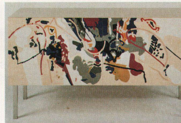
Einmal schwarz, einmal hell: Die Entwürfe des Malers Francescini fordern den Intarsienmacher technisch (rechts)