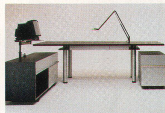
Aus Holz und Aluminium von Kurt und Benjamin Thut für Seleform (Bild oben) Modulsystem für alle Fälle von Lista (unten)

ein Modulsystem, das beliebig zusammengestellt und ausgebaut werden kann. Die Firma spricht gar von einem «Riesenschritt in Richtung ausbaufähiger Systeme und flexibler Gestaltung des Arbeitsumfeldes». Massgeschneiderte Büros oder Konferenzsäle von Lista kann man sich aus verschiedenen Tischflächen und Tischgrössen sowie aus Unterstell- oder Beistellkorpusen mit höhenverstellbaren Beinen einrichten. MW