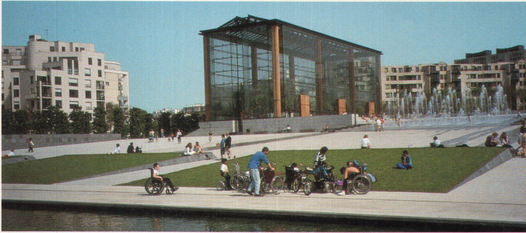
Eines der beiden imposanten Glashäuser mit der Brunnenanlage und vorgelagertem Platz