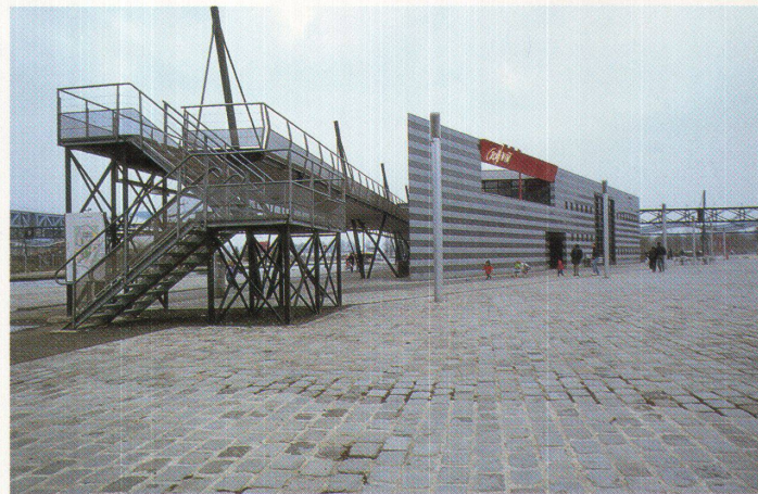
Parc de la Villette bei Tag (oben) und bei Nacht – eine Fülle architektonischer Inszenierungen begleiten die Verbindungsachsen