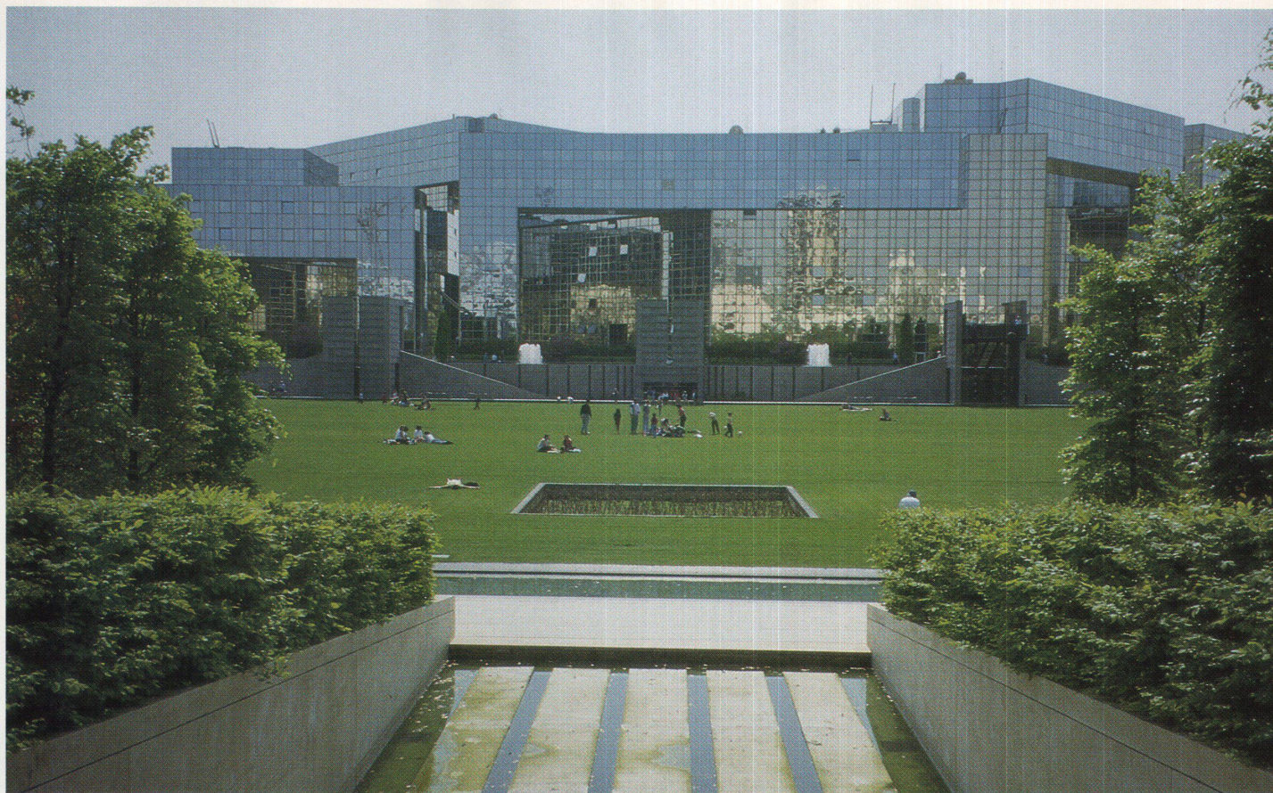
Parc André-Citroën: Blick von der Galerie der seriellen Gärten über die Wiese auf den futuristischen Verwaltungskomplex im Westen des Parks