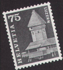
Gelangte zu Berühmtheit: Hartmanns Briefmarke der Luzerner Kapellbrücke (1960)