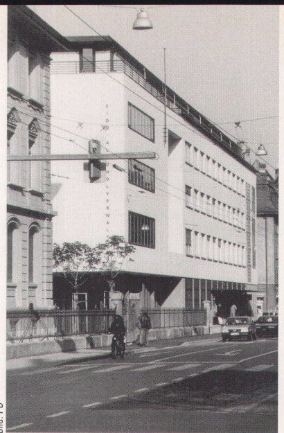
Die Eidgenössische Alkoholverwal- tung: «aus alt mach neu»