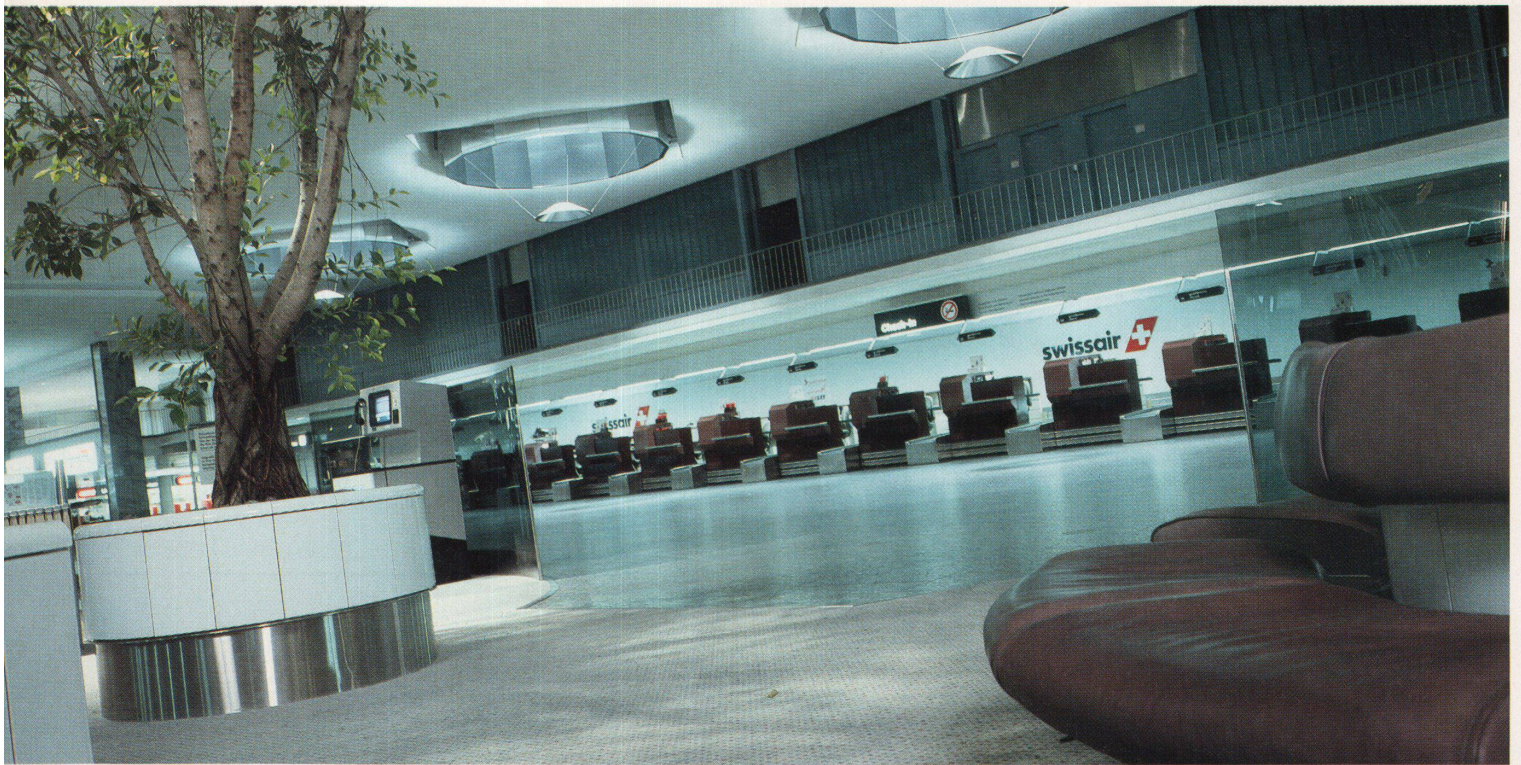
Abflughalle für die First Business Class