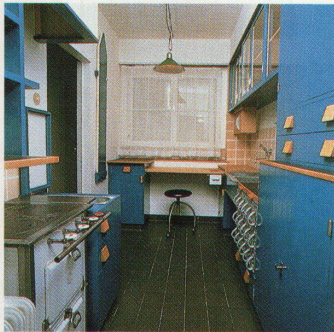
Die «Frankfurter Küche» (1926) war die erste typisierte Einbauküche